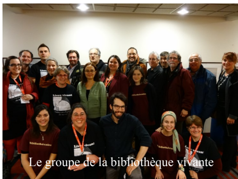
Le groupe de la bibliothèque vivante

Vous aimeriez vivre ou organiser une action semblable de lutte contre la stigmatisation? Surveillez-nous! L'AQRQ et le GPS-SM travaillent à vous offrir une formation et un accompagnement pour vos premières (ou prochaines) actions de lutte contre la stigmatisation! À bientôt!