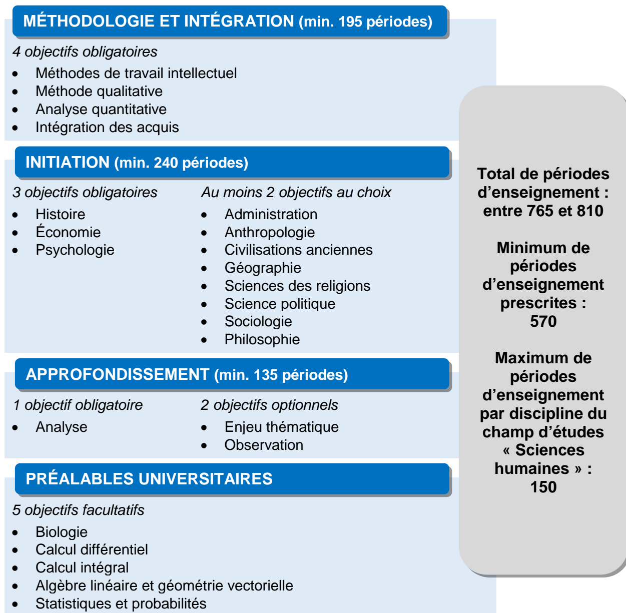
Figure 2 – Vue d'ensemble de la formation spécifique du programme d'études préuniversitaires Sciences humaines – Premières Nations et Sciences humaines – Inuits