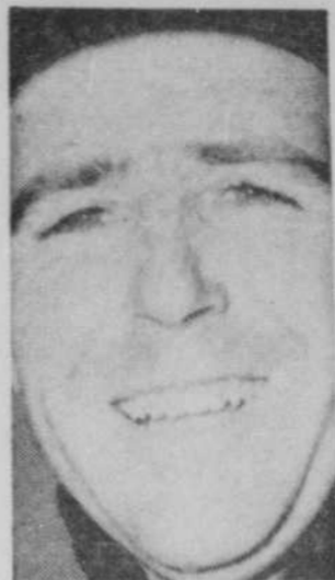
Gary Player, l'un des quatre golfeurs dans l'histoire à capturer les honneurs de quatre importants tournois, vient de confirmer sa présence à Montréal, à l'occasion de l'Omniium des golfs qui sera présenté dans le cadre de l'Expo, au club Municipal renoué, du 29 juin au 2 juillet.

Le lendemain, dimanche, les cyclistes auront encore une distance de 50 milles à parcourir, parcouru qui leur fera emprunter les rues Alouette, De Brest, Fatima et Bédard, depuis le parc Chertier, dans le nouveau quartier Duvernay. Le couronnement officiel et la remise des prix auront lieu en soirée, à l'ancien hôtel de ville de Vimont. Rappelons que ce 3ème Grand Prix cycliste est organisé conjointement par la ville de Laval et la brasserie Labatt.