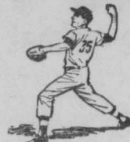
HIER LIGUE NATIONALE Cincinnati à N. York (remise) Atlanta à Pittsburgh (plus) LIGUE AMERICAINE Chicago à Baltimore (remise) Kansas City à Minnesota (plus) Cleveland à Washington (soir)

Les Mets ont déjà contremandé deux parties locales le mois dernier alors que la température new-yorkaise ne se prêtait guère au baseball.