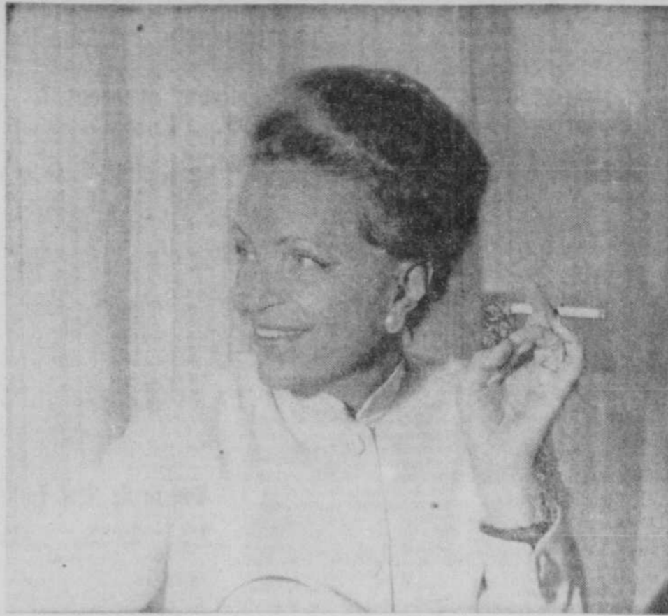
Belle et grande dame de l'aviation française, Jacqueline Auriol, seule femme pilote d'essai au monde est de passage à Montréal pour visiter l'Expo. Il y a dix-huit ans que Jacqueline Auriol vole et elle n'a pas du tout l'intention d'arrêter. Ses deux fils sont également pilotes. Son rêve: prendre les commandes des avions supersoniques Concorde et Mirage.

Montréal profitera-t-elle de cette terre nouvelle pour y installer son premier village d'enfants? Ce serait sans doute le meilleur moyen d'ouvrir cette TERRE DES HOMMES aux plus démunis des enfants d'aujourd'hui, ceux qui souffrent de la guerre que se li-