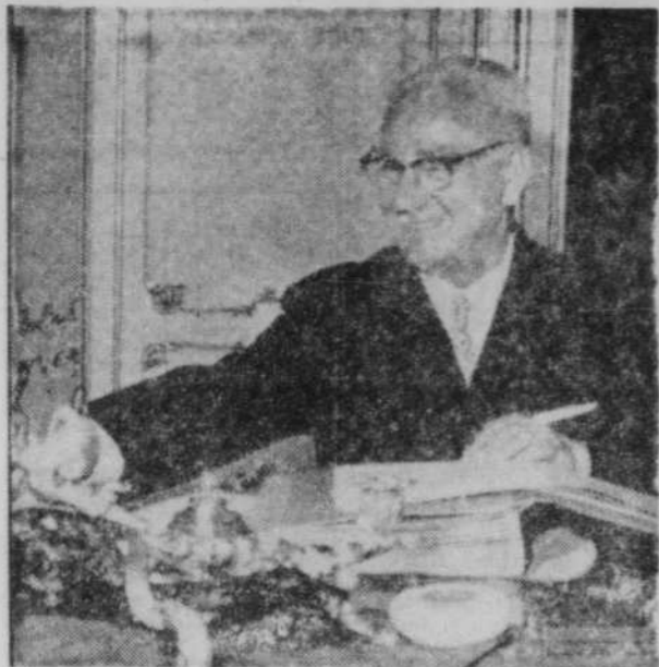
Le président de l'Autriche, M. Franz Jonas.