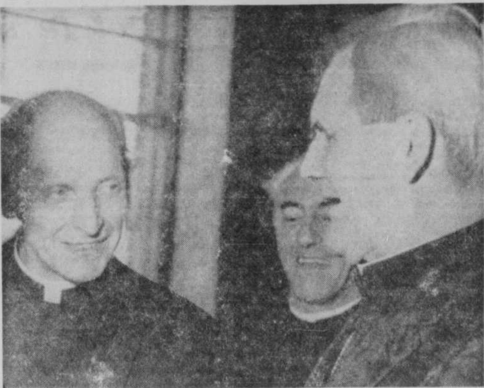
Poursuivant sa tournée canadienne, le père Pedro Arrupe, supérieur général de la Société de Jésus, a rencontré hier à Montréal divers groupes de jésuites, responsables d'œuvres spirituelles ou sociales, de même que le personnel religieux et laïc des collèges dirigés par la Société. On le voit ici en compagnie du cardinal Paul-Emile Léger auquel il a rendu visite hier midi. Aujourd'hui, dernier jour de sa tournée, le père Arrupe rencontrera les novices à Saint-Jérôme ainsi que les membres de la commission dite "des ministères" qui effectuent présentement une enquête sur l'activité des jésuites au Canada français.