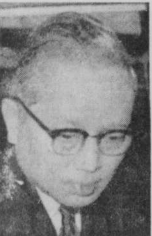
VOIR PAGE 8: M. THANT ET LE VIETNAM

"Vu ces événements, et d'autres qui ont suivi mes propositions du 14 mars tendant à une trêve générale avec maintien en l'état, je tiens à bien préciser les faits. Peut-être savez-vous tous, à l'heure actuelle, qu'aucune des deux parties n'a accepté intégralement et sans condition ces propositions qu'il faut donc considérer comme n'étant pas à l'étude. Quoi qu'il en soit, je suis convaincu que, maintenant comme auparavant, le premier obstacle à des entretiens demeure la continuation des bombar-