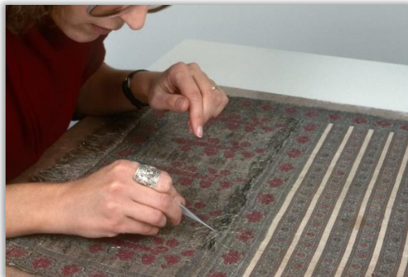
Restauration d'une écharpe perse en brocart de soie et fils d'argent provenant de la collection de textiles islamiques du Musée des beaux-arts de Montréal.

LITTLE, Sharon, "Contribution to the Study of Artisanat: a Case of the Weaving Industry of St-Laurent, Île d'Orléans, Québec", Québec, Université Laval, mémoire de maîtrise, 1978, 121 p.