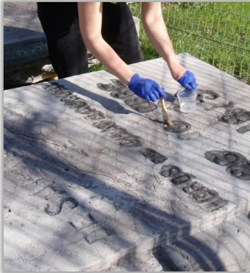
Restauration du monument Salaberry (statue et socle), Louis-Philippe Hébert, 1881.