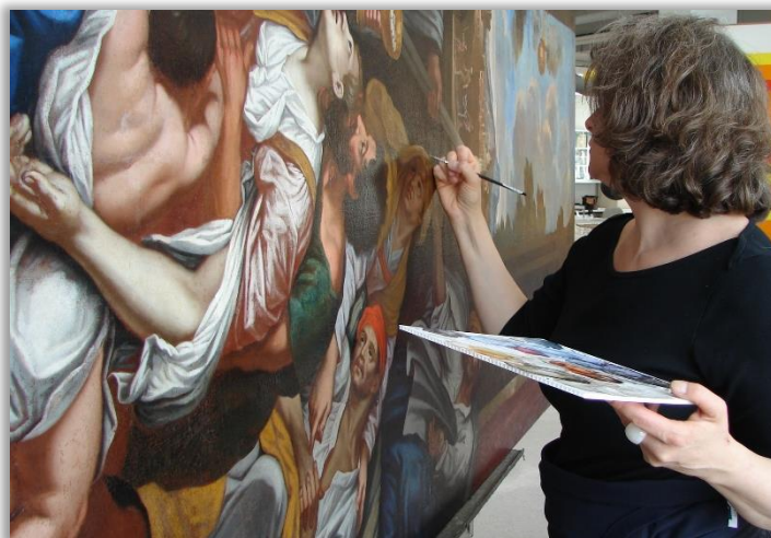
Retouche sur le tableau anonyme Saint Charles Borromée distribuant la communion aux pestiférés de Milan, fin du XVII e siècle.

PAQUETTE, Éloïse, "Helping with what is dear", Saving Haiti's Heritage: Cultural Recovery after the Earthquake , Washington D.C., Smithsonian Institution, 2011, p. 175. En ligne ici.