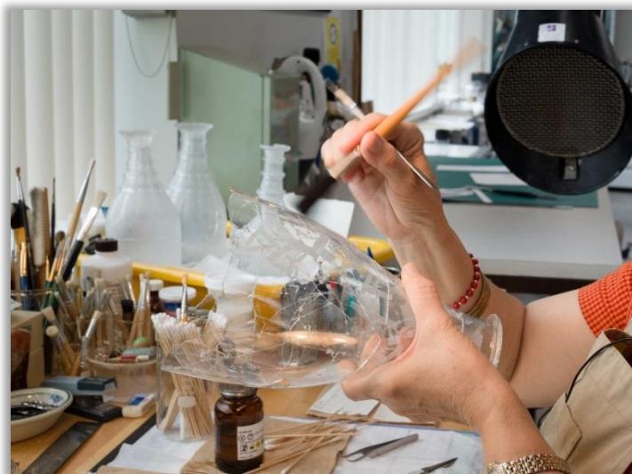
Restauration d'une carafe de verre provenant des Forts-et-Châteaux-Saint-Louis.

RÉMILLARD, France, « La mode et le costume », dans Michel Lessard, Objets anciens du Québec , vol. 2, Antiquités du Québec : la vie culturelle et sociale , Montréal, Édition de l'homme, 1994, p. 48-94.