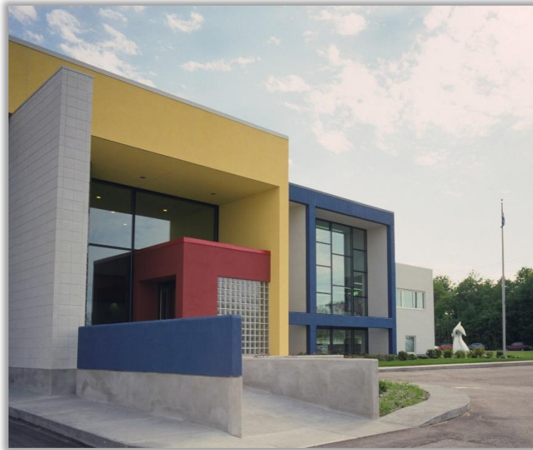
Centre de conservation du Québec.

Préventive Conservation in the museums : Video Handbook , Québec, Montréal, Centre de conservation du Québec; UQÀM; ICC, 1995. En ligne ici.