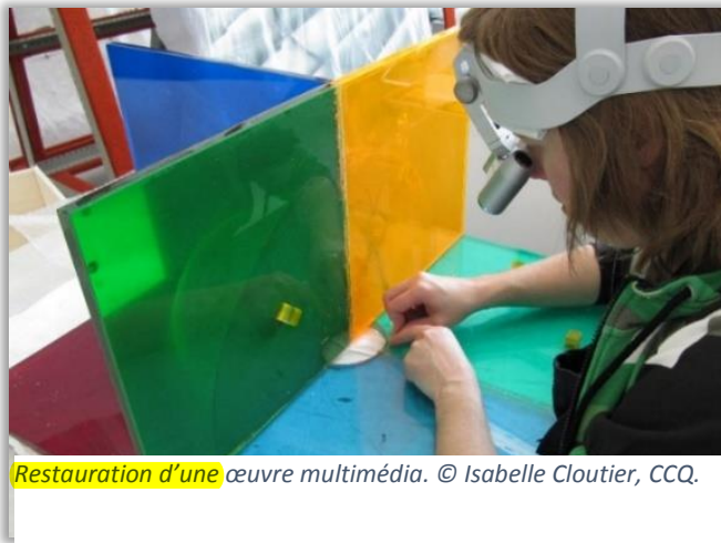
Restauration d'une œuvre multimédia.

GAGNÉ, Stéphanie, « Couche de protection ou antigraffiti », Guide pour la conservation des œuvres d'art public , Québec, Centre de conservation du Québec, 2015, p. 325-328. En ligne ici.