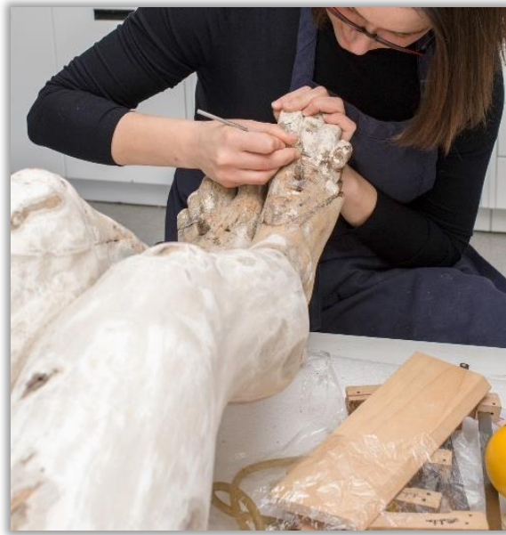
Restauration du corpus du Calvaire de Trois-Rivières érigé en 1810.

BERGERON, André, Patrick ALBERT et Bernard VALLÉE, « Le traitement d'une porte de cabine découverte lors de la fouille du Lady Sherbrooke », Journal de l'Association canadienne pour la conservation et la restauration des biens culturels (ACCR) , vol. 26, 2001, p. 8-14.