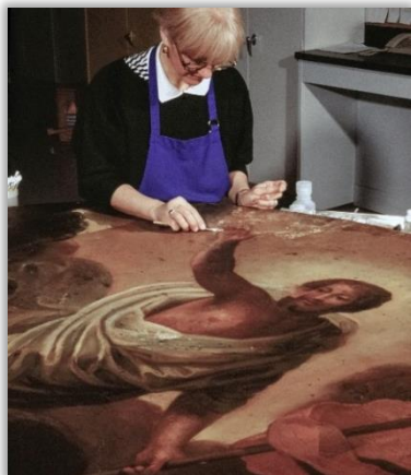
Restauration du tableau La Résurrection par Jean-Baptiste Corneille, XVII e siècle. Église Saint-Henri-de-Lévis.

O'MALLEY, Michael, « Mutual Aid Agreements for Disaster Preparedness and Response », Help! A Survivor's Guide to Emergency Preparedness , Museums Alberta, 2001, p. 65-66.