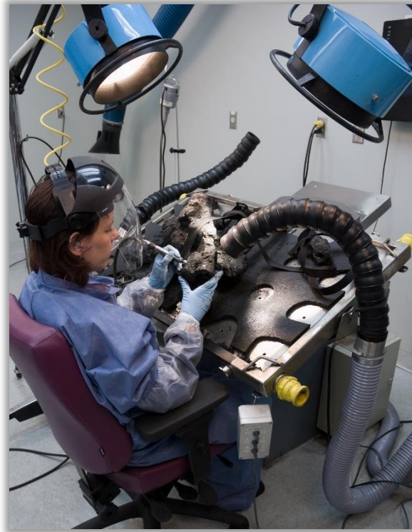
Dégagement fin d'une concrétion provenant de l'épave du Elizabeth and Mary.

PAÏN, Silvia et Kateri MORIN, « Veste d'adolescent XVIII e siècle », Les choix de la mémoire : patrimoine retrouvé des Yvelines , Paris, Somogy, Éditions d'Art, 1997, p. 80-81.