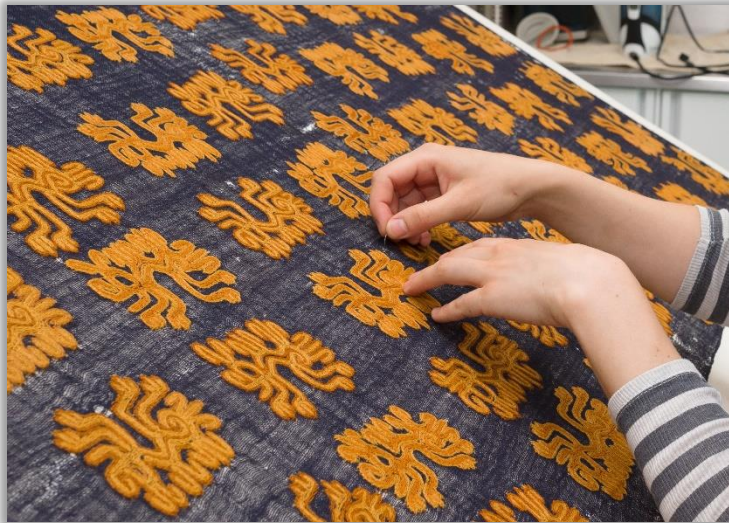
Restauration d'une cape d'ensevelissement de la culture Paracas, Nasca (Côte Sud, Pérou), 300 à 200 avant J.-C.