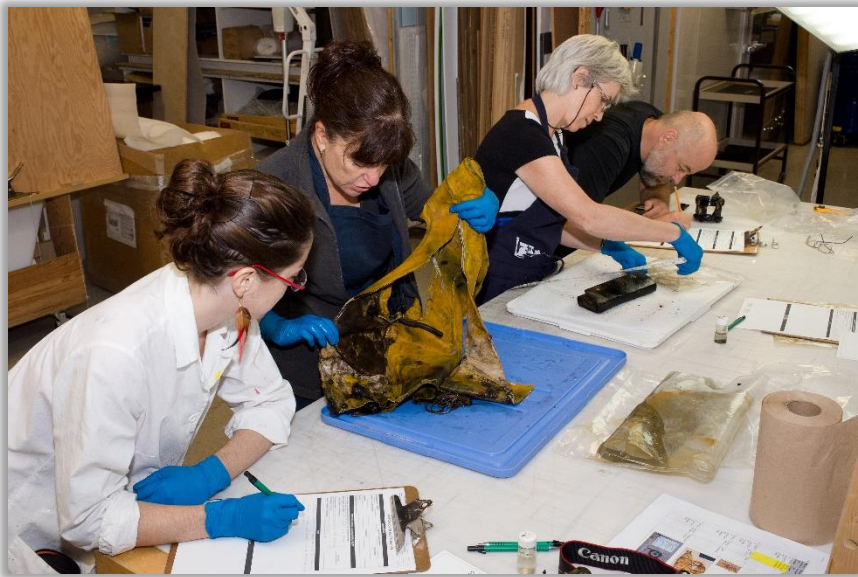
Restaurateurs à l'œuvre lors de la production d'une série de constats d'état pour des objets provenant d'une épave d'hydravion.

DAUX, Blandine, collaboration aux textes, La restauration des céramiques archéologiques : quelques exemples du cheminement d'une pratique , Québec, Centre de conservation du Québec, 2007, 160 p.