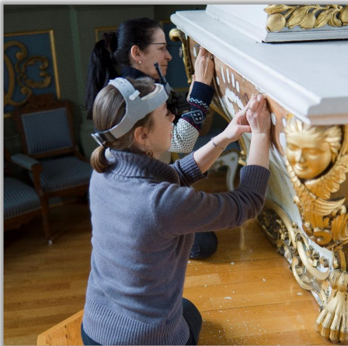
Test de dégagement au scalpel de la polychromie du tombeau du maître-autel de l'église de Sainte-Famille, Boucherville.