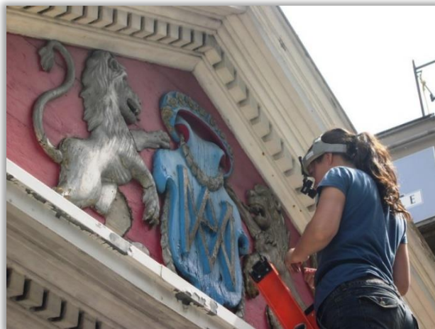
Expertise des armoiries des Sulpiciens du Vieux Séminaire de Saint-Sulpice, Montréal.

PARADIS, Isabelle, « Fiche 1 : Le restaurateur et sa profession », « Fiche 9 : Les sculptures, bois et plâtre », « Fiche 10 : Les œuvres de pierre », « Fiche 12 : Les vitraux », « Fiche 15 : Le rangement des objets » et « Fiche 16 : L'exposition des objets », Les biens d'églises : conservation et entretien du patrimoine mobilier , Québec, Centre de conservation du Québec; Fondation du patrimoine religieux du Québec, 2001. En ligne ici.