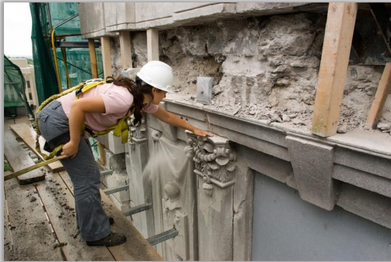
Expertise sur la façade de l'hôtel du Parlement du Québec.

MORISSETTE, Jérôme-René, Sauvegarde des monuments de bronze , 3 e éd., Québec, Centre de conservation du Québec, 1997 (1 re éd. 1988, 2 e éd. 1992), 36 p.