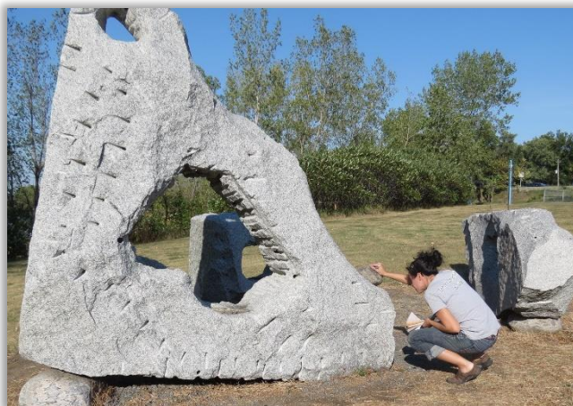
Expertise sur Islas de Agua de Lourdes Cue, 1995. Collection d'art public de la ville de Longueuil.

CLOUTIER, Isabelle, « Céramiques », Guide pour la conservation des œuvres d'art public , Québec, Centre de conservation du Québec, 2015, p. 117-145. En ligne ici.