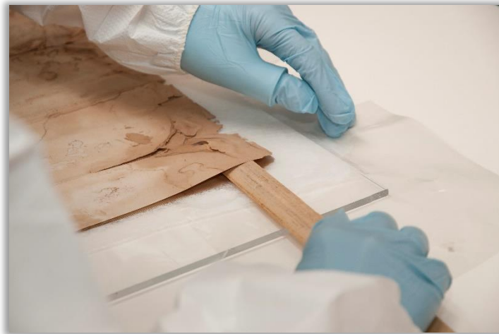
Inventaire des documents trouvés dans la capsule temporelle en bois placée sous le socle du monument de Salaberry, Chambly.

HOLM, Susanne-Marie, Le montage et l'encadrement des œuvres sur papier , Québec, ministère des Affaires culturelles, 1982, 27 p.