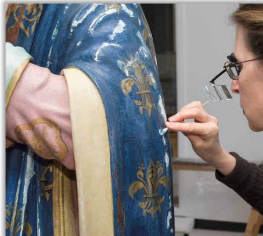
Enlèvement de surpeints sur une statue de la Vierge Marie en bois polychromé, issue de l'Atelier des Écores, 1811.

LEPAGE, Michèle, notice n° 14 et n° 19 du catalogue, Restauration en sculpture ancienne : catalogue d'exposition , Québec, Musée du Québec, 1994, p. 108-115.