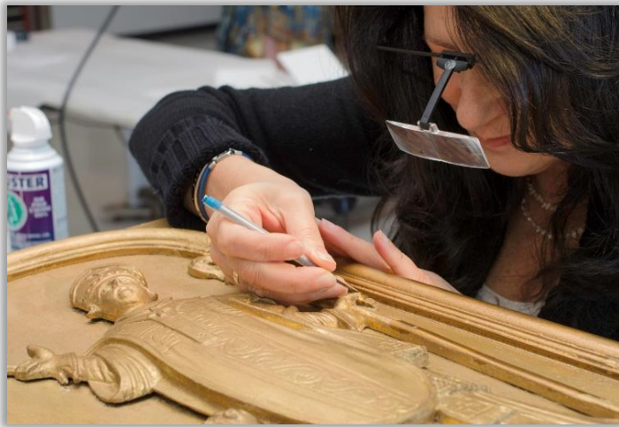
Dégagement de la dorure d'un élément de l'autel du Sacré-Cœur des Sœurs Grises de Montréal, Philippe Liébert, 1790.

BELLEAU, Claude, « Historique de la restauration au Musée du Québec » et notices n° 12, 15, 16, 17, 18 du catalogue, Restauration en sculpture ancienne : catalogue d'exposition , Québec, Musée du Québec, 1994, p. 41-49.