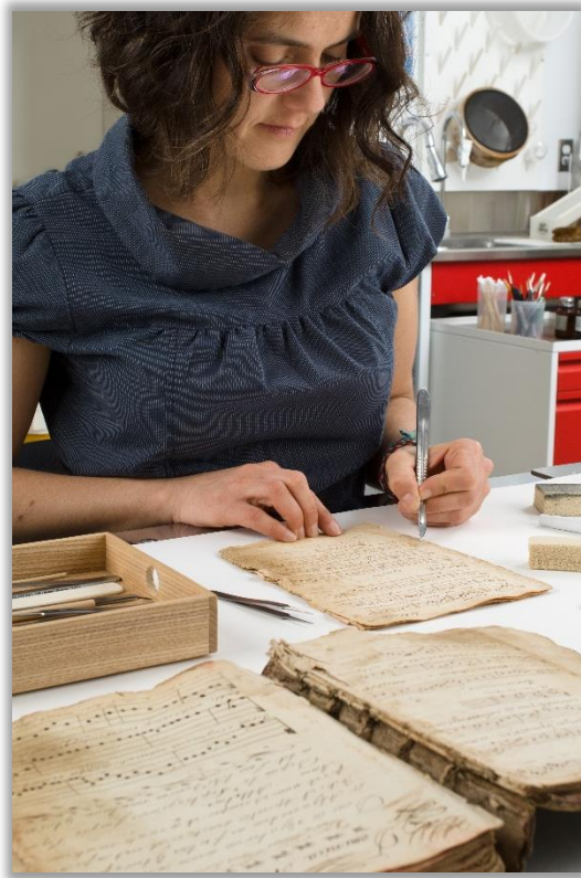
Restauration d'un livre manuscrit de chants liturgiques appartenant à la mission abénaquise de Saint-François-de-Sales, maintenant appelée Odanak, 1673-1755.