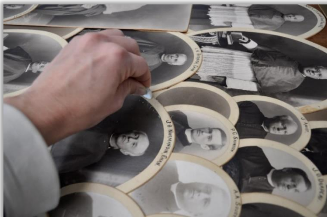
Nettoyage d'une mosaïque photographique, Archevêché de Rimouski.

ALLARD, Denise, « Fiche 3 : Les archives et les œuvres sur papier », Les biens d'églises : conservation et entretien du patrimoine mobilier , Québec, Centre de conservation du Québec; Fondation du patrimoine religieux du Québec, 2001. En ligne ici.