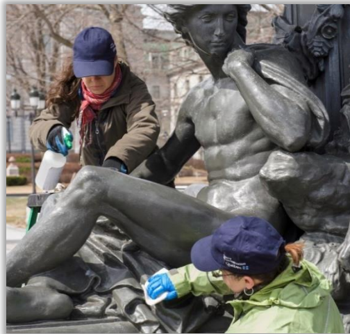
Entretien de la fontaine de Tourny, 1864.

CONNORD, Aude, « Le siège de Saragosse : étude et restauration d'un plan-relief, début du XIX e siècle (Musée des Plans-Reliefs, Paris) : recherche d'une méthode pour le remontage des petits éléments », Paris, Institut national du patrimoine, mémoire de master de restaurateur du patrimoine, 2012, 205 p.