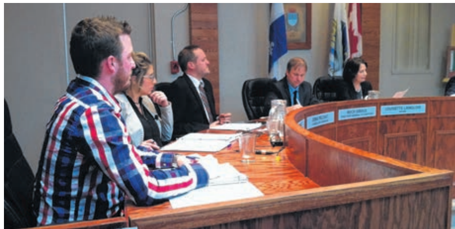
Quelques membres du conseil municipal lors de la région des conseillers et du maire à Chandler.