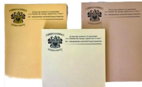
Calepin- Note Pad 4.25''x5.5''- $ 2.00