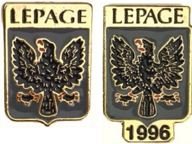
Bouton Prestige-Pin- $4.00 1''x 1.5''