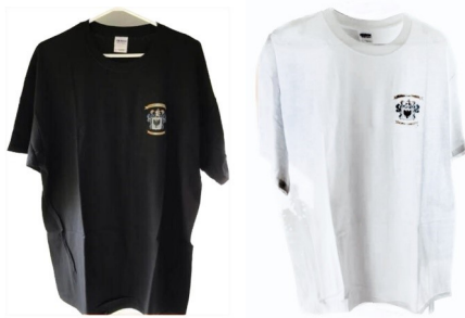
T-Shirt-Noir ou Blanc (M-L-XL-XXL) -Black or White - $ 15.00