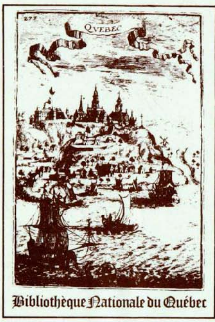
Bibliothèque Nationale du Québec