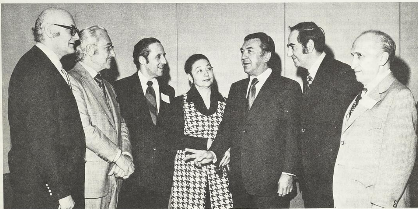
Photo prise au cours de la Conférence du Congrès Juif Canadien, Région de l'Est, en l'Hôtel Reine Elizabeth le 28 Janvier.