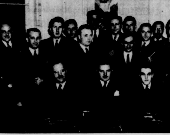
Les membres du Jeune Commerce des Trois-Rivières comprenant bien les devoirs de civisme qu'une association comme la leur doit s'imposer, se sont tant pour une deuxième année dans le cadre de souscriptions en faveur de l'oeuvre du Timbre de Noël.