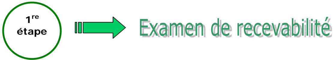
Schéma I :

L'examen de recevabilité est réalisé par les services du ministère de l'Agriculture.