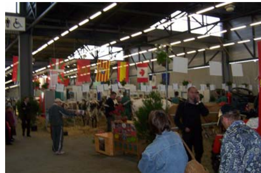
Salon de l'agriculture