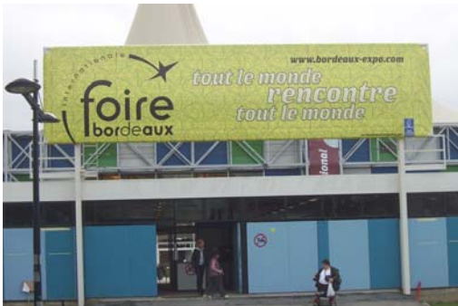
Foire de Bordeaux