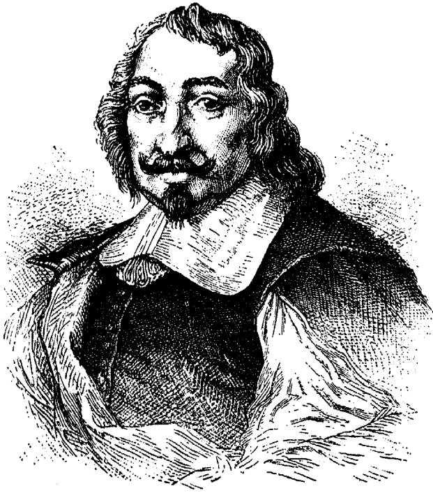
SAMUEL DE CHAMPLAIN