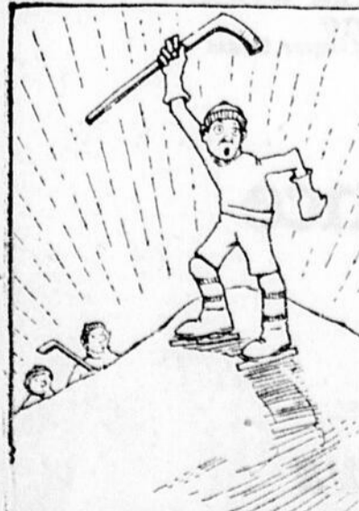
La Revanche de ROCKBURN. L'ex-loueur de La Salle a donné la victoire aux Artilleurs samedi.