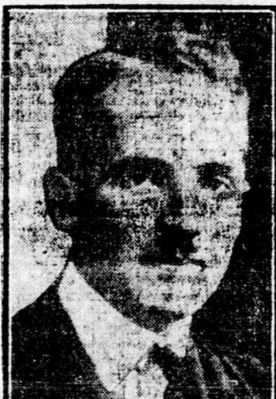
Dr CHARLES BEST, co-inventeur de l'insuline avec le Dr F. G. Banting, a été nommé professeur de physiologie à l'Université de Toronto. Il succède au professeur J. L. MacLeod, qui est passé à l'Université d'Abertdeen.

Nous recevons cet après-midi de la Presse Associée, la nouvelle suivante, que nous publions sous toute réserve: ROME, 14.—Une entente est intervenue entre le Vatican et le Quirinal, qui apporterait une solution à la fameuse question Romaine. En vertu de cette entente le papauté reçoit une petite extension territoriale et une indemnité de 1,000,000,000 de lires italiennes.