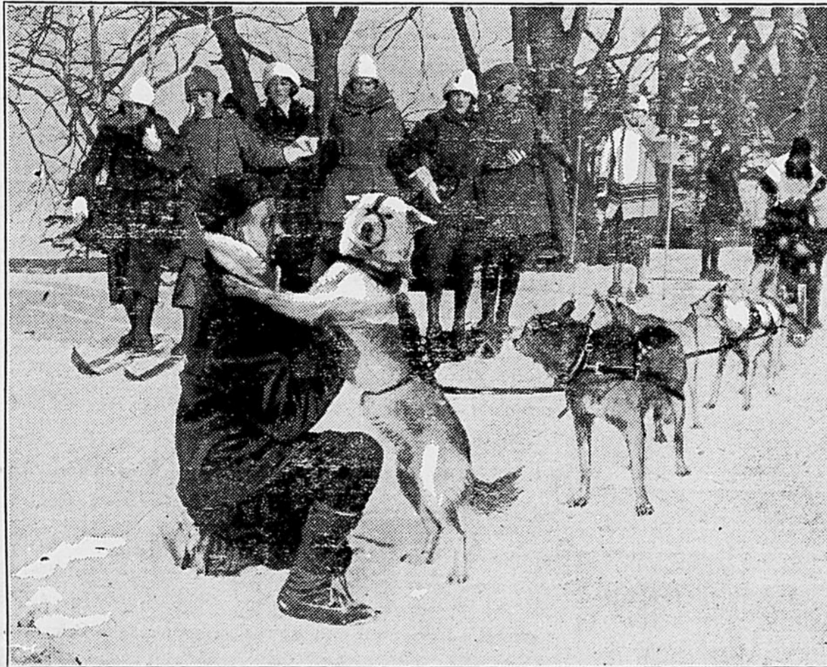
L'attelage de chiens esquimaux du Château Frontenac.

Québec sera cette année le centre de sports d'hiver le plus fréquenté de l'Amérique du Nord. Depuis déjà quelques années, les fervents des amusements que procure la neige et la glace, se donnent rendez-vous dans l'antique capitale de la Nouvelle-France, qui offre pour la pratique de ces sports hygiéniques et vivifiants, un cadre charmant, pittoresque et unique sur ce continent. Le ski sur la côte de la Citadelle et sur les collines qui entourent la ville, la raquette à travers les campagnes environnantes et jusqu'à la chute de Montmorency, la toboggan sur la superbe glissoire de la Terrasse Dufferin, le patin dans les diverses patinoires de la ville, le curling, etc., tous ces sports ont chacun leurs adeptes qui se recrutent non seulement parmi la population de Québec ou même de la province, mais encore dans toutes les parties du pays et des états de la république voisine. Chaque année voit grandir la vogue de la vieille cité de Champlain comme station hivernale. Il n'est donc pas exagéré de dire qu'elle peut rivaliser aujourd'hui avec Chamonix, St-Moritz, Superbagnères et autres endroits fameux en Europe.