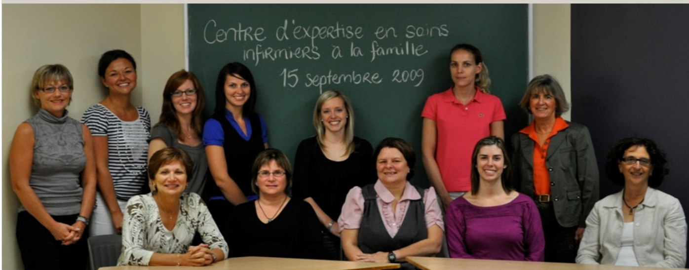
Professeures et participantes à un atelier de formation