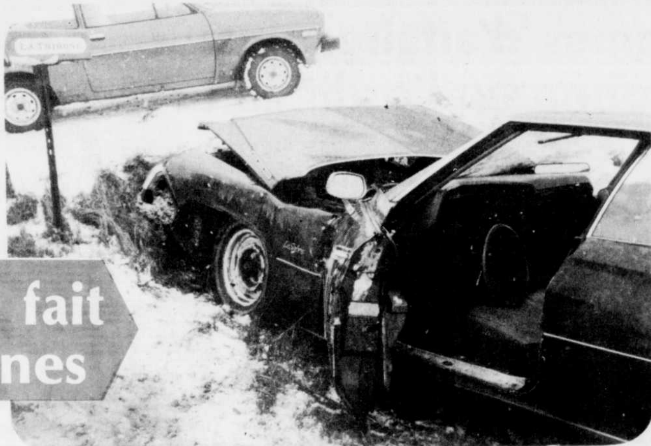
Un jeune couple blessé dans un premier accident survenu sur la route 143, entre Windsor et Bromptonville, a connu malgré lui une seconde embarquée lorsque l'ambulance qui les transportait au CHU a quitté la route à la hauteur du rang 4 de Stoke.

Selon les informations recueillies, Patrice St-Amant, de Sherbrooke et Laurence Castonguay, de Bromptonville, n'auraient pas subi de blessures supplémentaires lors de l'embarquée de l'ambulance, eux qui avaient déjà subi de multiples blessures lorsque leur véhicule a glissé