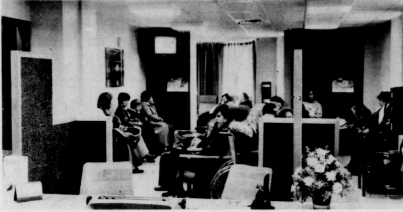
Des locaux plus fonctionnels permettront de réduire la période d'attente des patients, ont indiqué les autorités. Les bureaux d'inscription sont maintenant plus fonctionnels.

L'Hôtel-Dieu joue un rôle important en région pour les soins d'urgence. Il accueille déjà 42% en moyenne des cas d'urgence dans les hôpitaux de Sherbrooke et sa périphérie. Ce pourcentage représente une