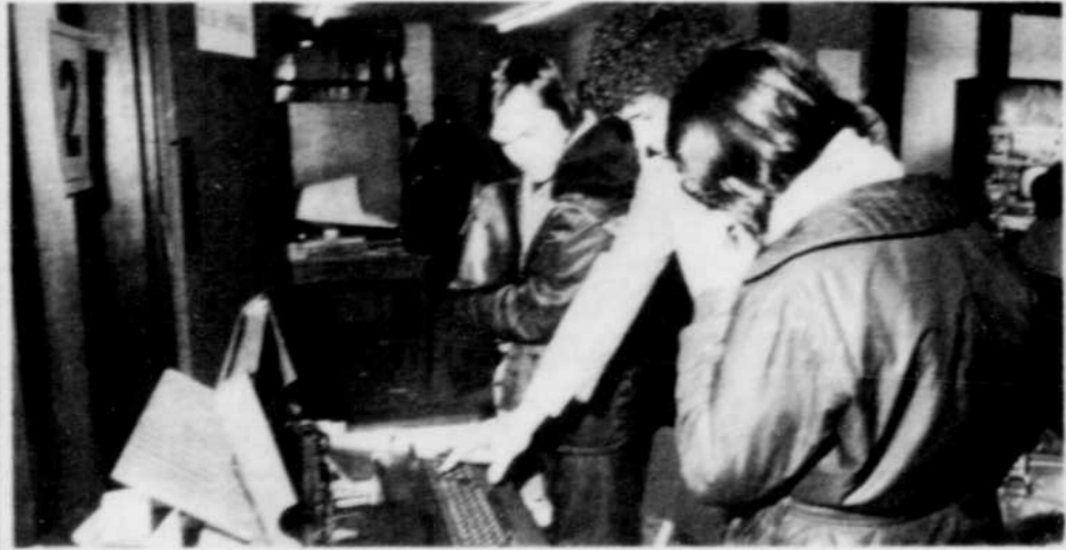
Le symposium sur l'ordinateur dans la petite et dans la moyenne entreprise a attiré des participants de la plupart des secteurs de l'économie.

Sans y aller par le menu détail, ils ont rappelé les circonstances dans lesquelles ils avaient connu l'informatique et quelles affaires ils avaient connues au moment où l'ordinateur est devenu à toute fin utile partie intégrante de leur entreprise et comment il rendait faciles des opérations qui exigeaient autrefois beaucoup de temps et du personnel qui aurait pu être affecté à d'autres tâches. D'un commun accord, ils ont affirmé que les entreprises qu'ils dirigent n'auraient pas connu l'expansion qu'elles ont connue sans ce précieux serviteur qui a ses caprices, certes, mais qui leur est rapidement devenu indispensable.