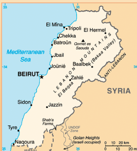
Carte du Liban

Depuis la négociation des Accords de Taëf (ou Document d'entente nationale ), ayant mis fin, en 1989, à une guerre civile d'une décennie et demie, Damas s'est porté garant de la paix dans la petite république multicommunautaire. La famille dirigeante Al-Assad, le père Hafiz, puis son fils Bashar, construiront ainsi une base politique de soutien à la « paix syrienne » par le biais d'une habile politique d'équilibre communautaire, de réseaux de renseignement, piloté par un quasi « gouverneur », le chef du renseignement syrien au Liban, et du recours occasionnel à la coercition. La pénétration des institutions sécuritaires et l'interférence politique seront donc des éléments caractéristiques du Liban d'après-guerre. En ressortira un climat intercommunautaire plutôt stable, bien qu'à tendance autoritaire et répressive, qui sera garanti par la marginalisation (l'emprisonnement ou l'exil) des élites hostiles à l'occupation syrienne – en particulier les élites maronites –, et l'instauration de politiques, notamment électorales, faisant la part belle aux élites cooptées par Damas. En contrepartie, les élites libanaises pourront maintenir leurs réseaux sociaux et leurs activités économiques, dont la Syrie a par ailleurs bénéficié par le biais d'un large contingent de travailleurs émigrés et de vastes réseaux de corruption.