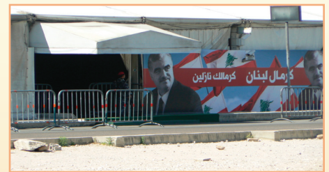
Mémorial de Rafiq Hariri sur la Place-des-Martyrs

Dans ce contexte, l'assassinat de Rafiq Hariri le 14 février 2005 va agir comme l'élément déclencheur de « l'Intifada pour l'indépendance » (renommé « la Révolution du cèdre » pour plaire au public occidental ; le terme intifada rappelant trop les soulèvements palestiniens). L'attentat spectaculaire, qui laissera un cratère gigantesque près du centre-ville de Beyrouth, a provoqué une polarisation du champ politique en amenant une bonne partie de la communauté sunnite à se joindre définitivement à la coalition anti-syrienne. Elle se mobilisera en grande partie en réaction à l'élimination de l'un de ses principaux leaders. Ainsi, c'est plutôt l'atteinte à « l'intégrité communautaire » qui va amener la population d'origine sunnite à descendre sur la Place-des-Martyrs le 14 mars 2005, où une immense