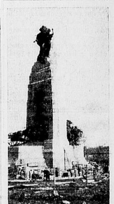
Pendant qu'on se hâte de faire des préparations pour la prochaine guerre, on se dépêche de compléter le monument national du Canada pour que le roi l'inaugure lors de sa visite à Ottawa.

Est-il besoin de répéter que le seul moyen d'empêcher des abus de se commettre, c'est l'unité de tous les travailleurs?