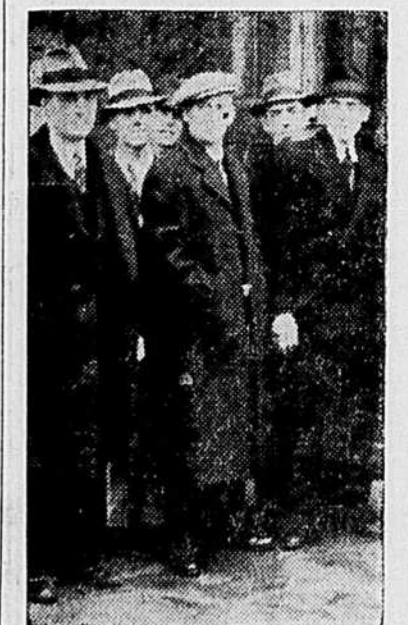
Alerté par des vols répétés de dynamite, attribués à des agents nazis, la Ontario Power Commission a posté des gardes spéciaux autour de leur usine à Niagara Falls.

Il y a deux ans, des aviateurs soviétiques ont fait un vol sans étapes de Moscou aux Etats-Unis à travers le Pôle Nord. Il y a un an, Kokkinaki a fait une randonnée sans étapes de Moscou à Vladivostok, une distance de 4,722 milles.