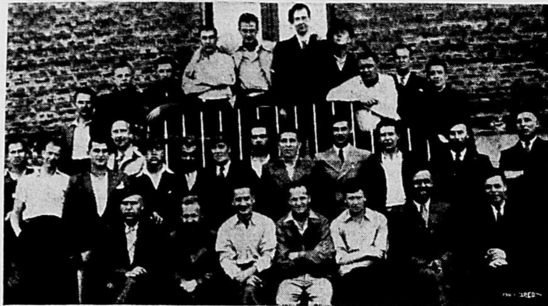
Pris par les fascistes en luttant pour la démocratie en Espagne, 32 Canadiens, soldats du Bataillon Mackenzie-Papineau, furent libérés récemment des prisons franquistes. Nous montrons un groupe de nos gars au Havre, en France, qui attendent l'embarcation pour revenir chez eux. Il y en a quelques uns qui sont maintenant en route pour le Canada.

Si la France et l'Angleterre sont les ennemis de l'Italie, elles pourront arrêter le transport des provisions sans grande difficulté. En cas de guerre de longue durée, l'Italie deviendrait plutôt à charge à son partenaire de l'axe, l'Allemagne.