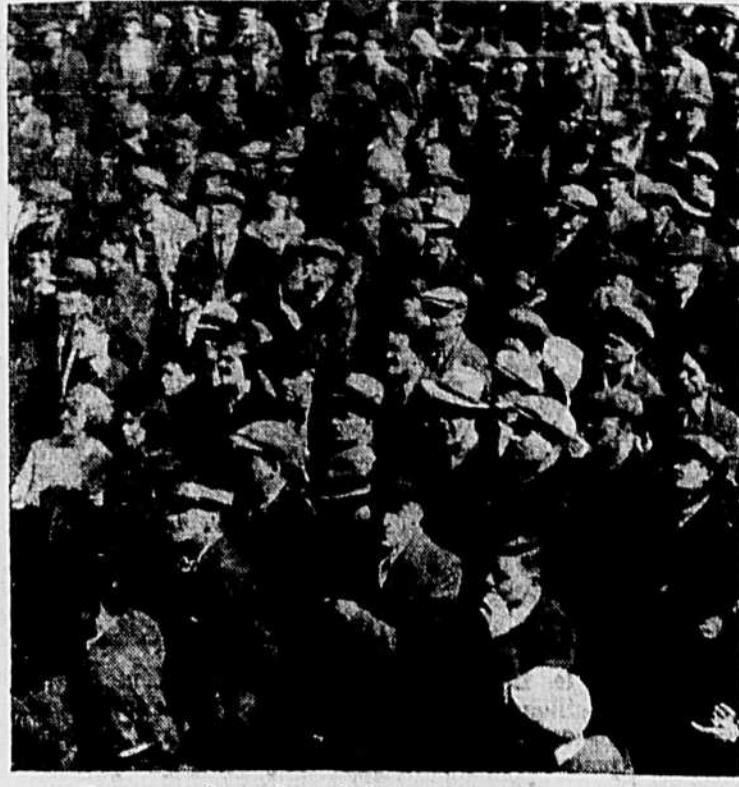
Des centaines de grévistes sans-travail ont marché des environs de Toronto au parlement de l'Ontario la semaine passée, comme protestation contre la diminution de 10 pour cent en secours-direct. Le premier ministre Hepburn a refusé de recevoir les délégués, mais après une longue attente ils sont arrivés à voir le ministre du bien public, qui a refusé aucune augmentation.

Le dragage des billots a commencé il y a six semaines en Colombie Britannique et déjà 60 hommes ont perdu la vie par accidents et noyades. Ces chiffres ont été donnés par le Conseil local de l'Union Internationale des Bûcherons.