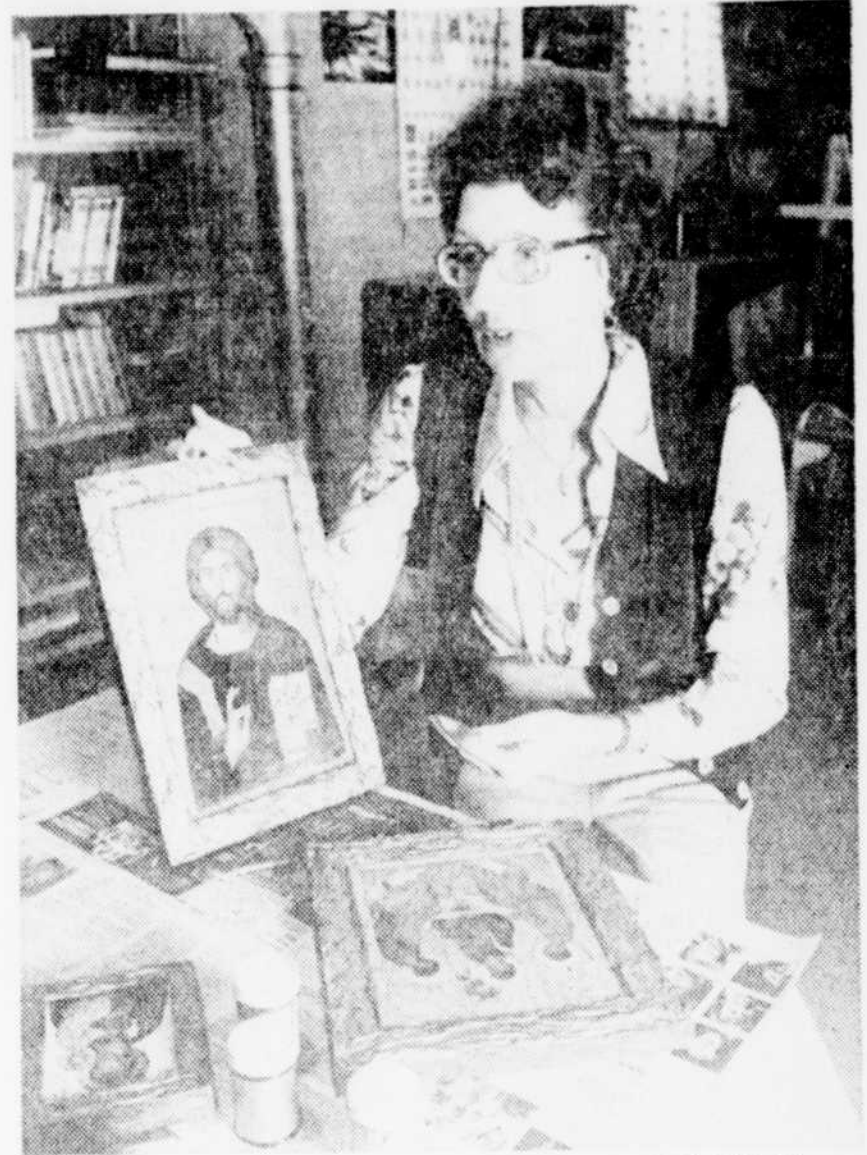
Le Soleil, Roland Marcoux