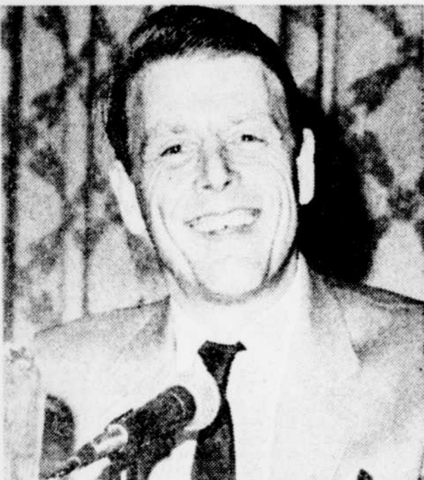
Edward Fox joue, dans "L'ouragan vient de Navarone", le personnage d'un dynamiteur plein d'humour qui ne se départit jamais d'un calme olympien.

Cette espèce de plaisir fiévreux face à l'héroïsme démesuré de soldats braves issus du dictionnaire des archétypes du cinéma, je l'ai retrouvé sans mélange en