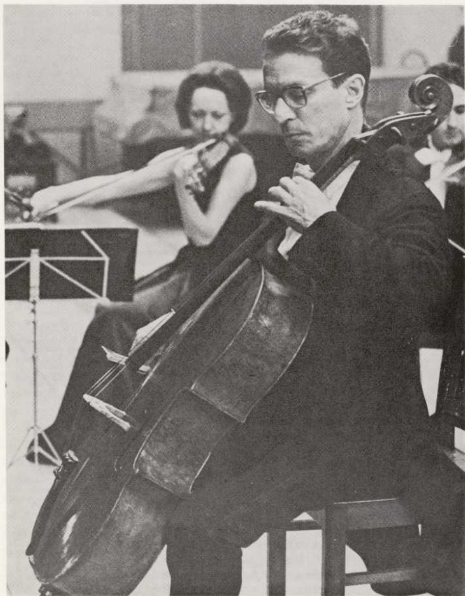
Antonio Janigro — Chef d'orchestre et soliste / Conductor and soloist