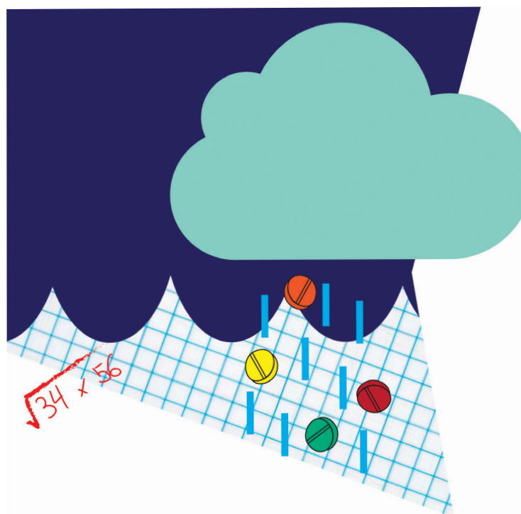
ILLUSTRATION CATHERINE LEGAULT

De l'avis de Marie-Hélène Véronneau, professeure au Département de psychologie de l'UQAM, plusieurs raisons peuvent pousser les étudiants à avoir davantage recours à des services