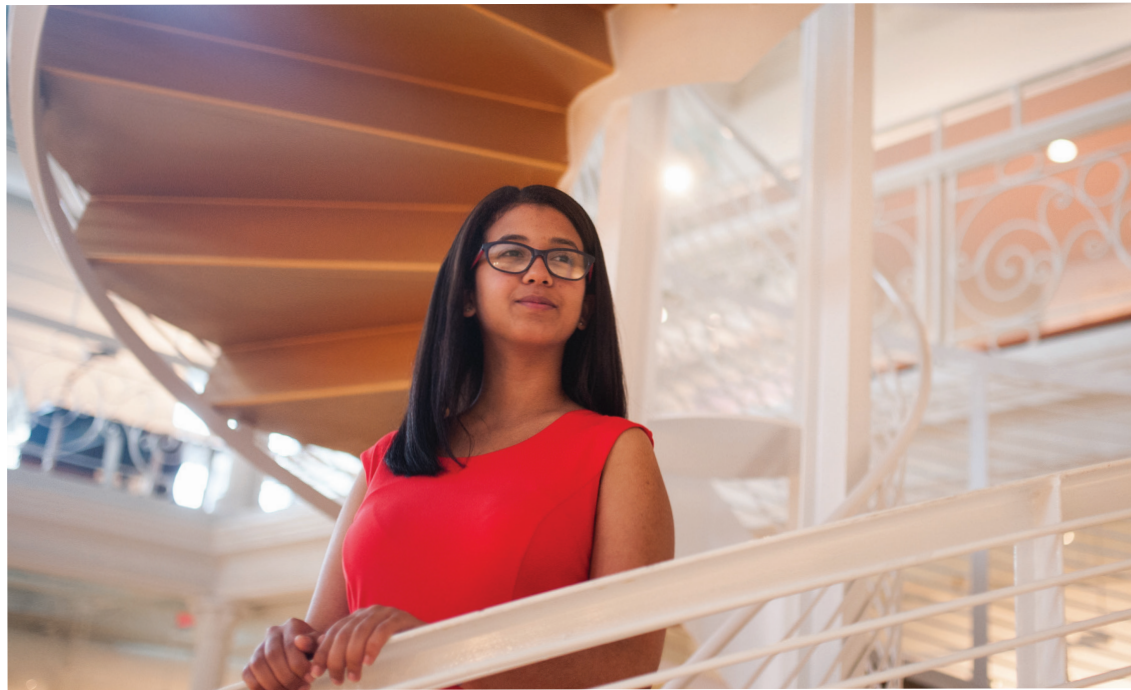
MONTREAL CAMPUS