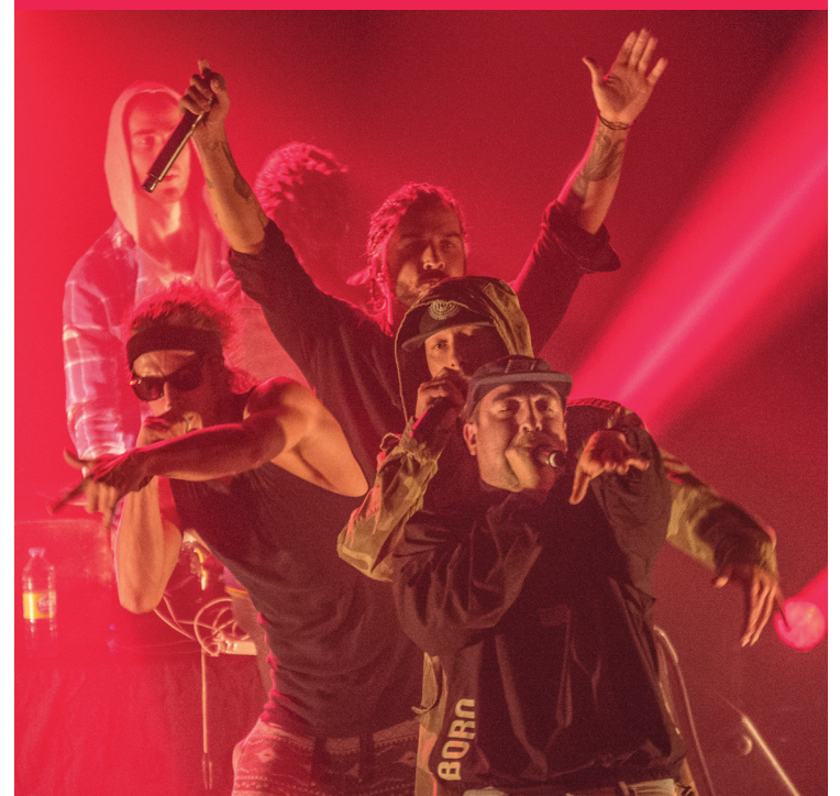
FÉLIX DESCHÈNES MONTRÉAL CAMPUS