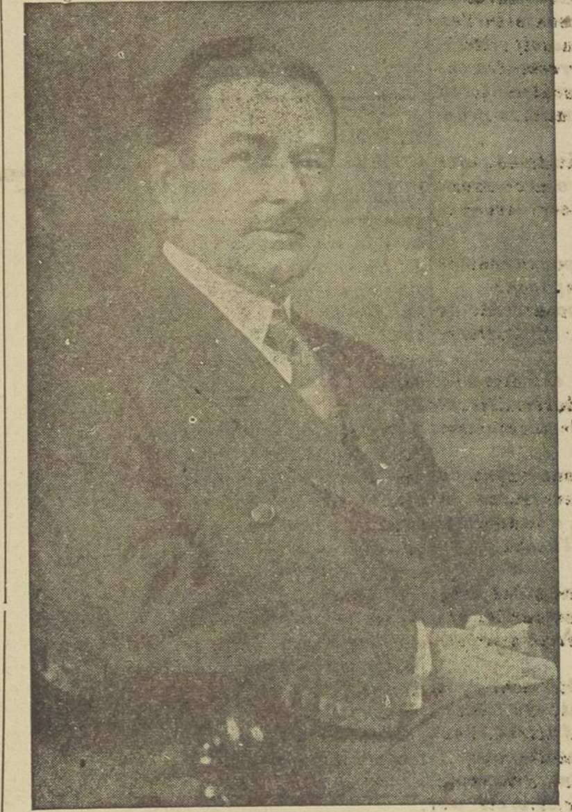
M. Maurice DUPLESSIS,

La tactique du gouvernement est simple. Ce régime a voulu à tout prix faire discontinuer l'enquête des comptes publiés. J'ai dit et je le répète: les scandales mis à jour par l'enquête du comité des comptes publics ne représentent pas une fraction d'un dixième de l'impôt de ce que nous sommes capables de prouver. Et croyez bien que j'ai exagéré pas. Vous vous souvenez que le 29 avril dernier, alors que vous avez bien voulu m'accorder un si touchant témoignage d'amitié pour