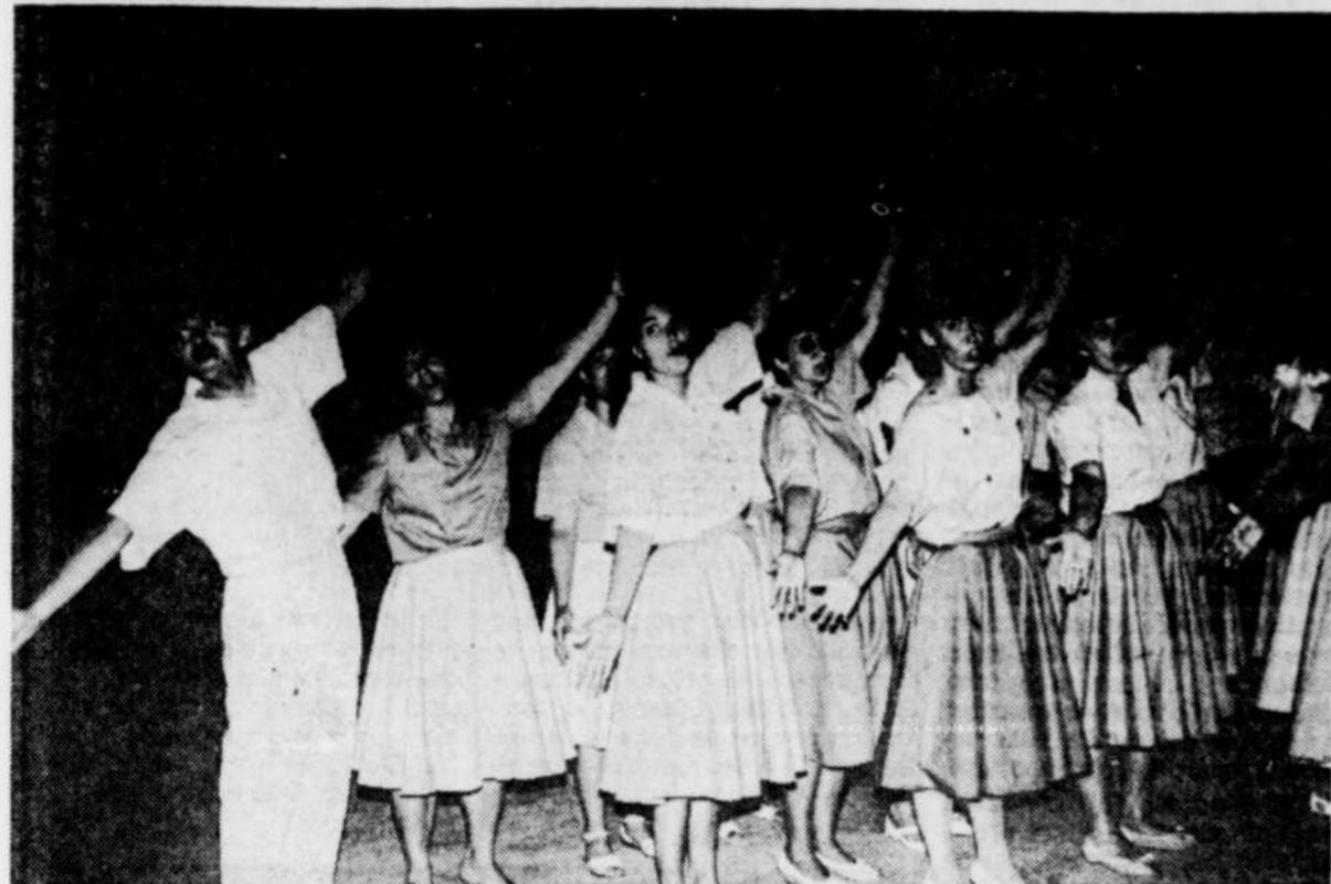
La troupe "Les couleurs du temps" sera en spectacle au Grand Théâtre vendredi.