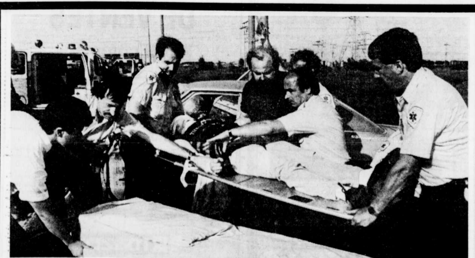
Gravement blessé. Il a fallu près d'une heure pour libérer ce blessé, emprisonné dans le véhicule qu'il conduisait. L'accident est survenu sur le boulevard de la Capitale, à la hauteur du boulevard Pierre-Bertrand, vers 17h00 hier. La voiture que conduisait la victime s'est écrasée contre un lampadaire sur les bords de l'autoroute. Les policiers ont utilisé les mâchoires de désincarcération pour libérer le malheureux, non sans peine d'ailleurs, car les boyaux de l'appareil sont restés coincés et ont retardé le travail des sauveteurs pendant de précieuses minutes.

La police n'a fait état d'aucun lien entre les arrestations et l'écrasement d'un Boeing 747 d'Air India, le 23 juin dernier, au cours duquel 329 personnes avaient péri au large de l'Irlande.