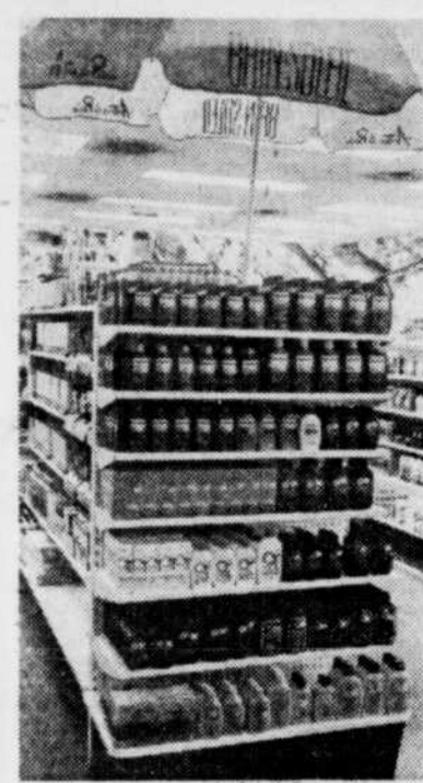
Le Soleil, Roland Marcoux

DIMANCHE 1er JUIN 1986 QUÉBEC, 90e année, no 152. 40 pages, 2 cahiers + 1 tabloïd Livraison à domicile (7 jours) 2.755 Iles de la Madeleine-Gaspé Rivière-au-Renard-Percé-Abitibi 65¢