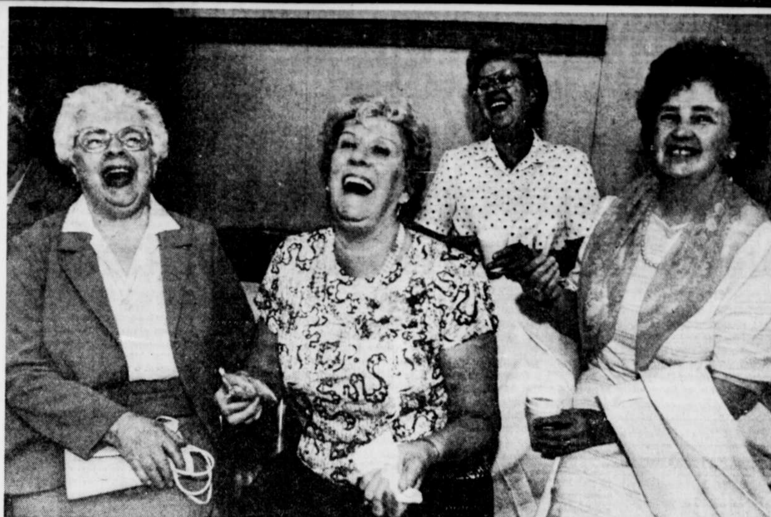
Ce n'était pas la première "amicale" à réunir les anciennes de Leonard School, hier après-midi. Mais ce sera la dernière dans les vieux murs de leur alma mater. La bonne humeur était cependant de rigueur.

À ce propos, M. Lemieux a dit que le message des villes, exprimé en termes à peine voilés, semblait très clair sur leur intention de se retirer des MRC, à défaut d'obtenir un plus grand pouvoir sur les décisions.