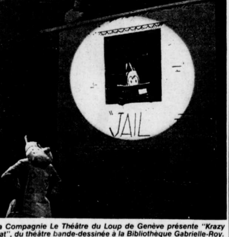
La Compagnie Le Théâtre du Loup de Genève présente "Krazy Cat", du théâtre bande-dessinée à la Bibliothèque Gabrielle-Roy.

Charlesbourg 11h à 14h: Brunch au restaurant Pizza Royale 13h à 16h: Clôture du Mini-Salon. Centre Socio-culturel. 19h30: Soirée de clôture au Patro de Charlesbourg. Invitée: la choral La couleur du temps. Deux expositions sont encore visibles aujourd'hui, il s'agit des travaux réalisés par les enfants à la bibliothèque de 13h à 17h et de la Galerie du Trait-Carré de 13h à 16h30.