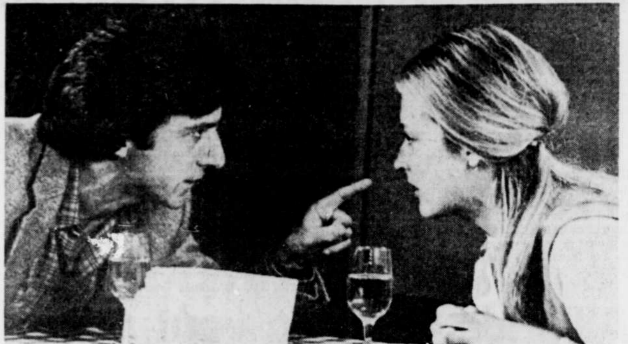
"Kramer vs Kramer": un drame familial joué par Dustin Hoffman et Meryl Streep, au sommet de leur art de l'interprétation. Ce film demeure aussi émouvant sur cassette que sur le grand écran.

Le "Rendez-vous" de Téchiné est un hommage beau et cruel aux comédiens de théâtre. Cette jeune comédienne (Juliette Binoche) qui "monte" à Paris et qui se précipite dans les bras du théâtre et des hommes qui le font est attachante dans son désir d'aller au bout d'elle-même. Elle trouvera l'amour