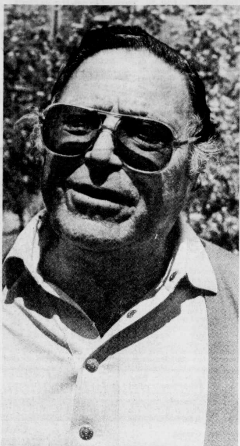
Raf Vallone devient Maximo Estrella, un aveugle qui retrouve en imagination les personnages de son joyeux passé dans "Luci di Bohème", au programme de la Quinzaine à partir de vendredi, au Palais Montcalm.

En attendant, il a le goût, en découvrant Québec dont la nature le séduit, de faire traduire son spectacle poétique sur l'amour, qui lui a valu, dit-il, les commentaires les plus dithyrambiques de toute sa carrière.