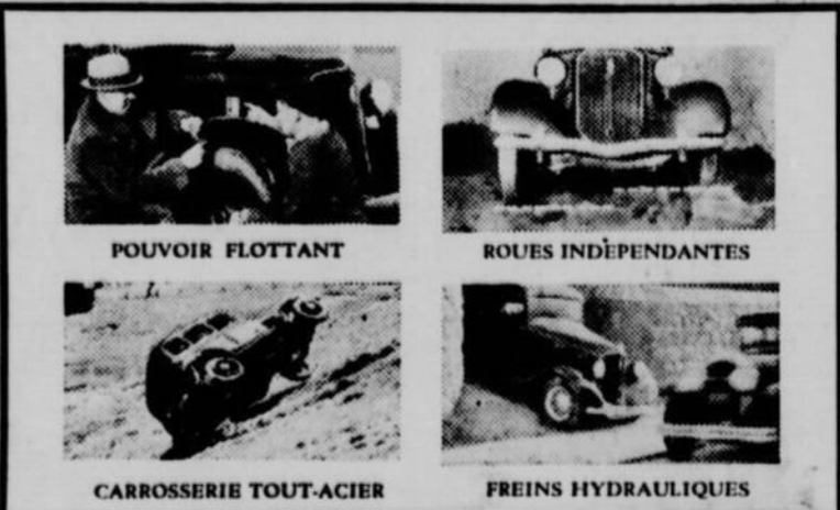
POUVOIR FLOTTANT ROUES INDÉPENDANTES CARROSSERIE TOUT-ACIER FREINS HYDRAULIQUES