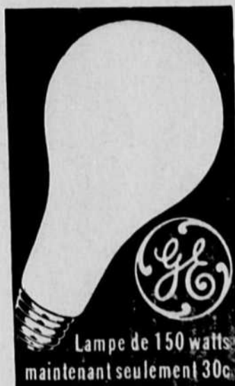
Lampe de 150 watts maintenant seulement 30c.

Eclairez-vous mieux... Épargnez vos yeux