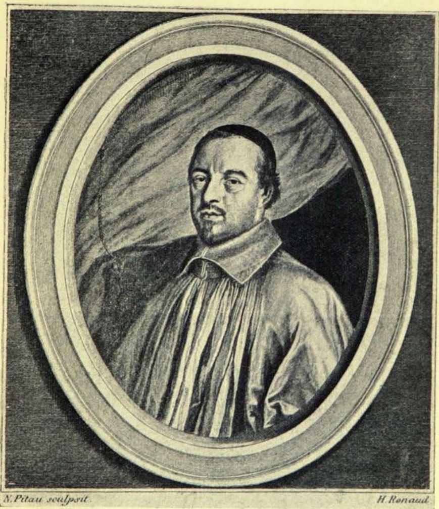
JEAN JACQUES OLIER 20 Sept. 1608 — 2 Avril 1657 Fondateur du Séminaire Curé de la paroisse de S t Sulpice