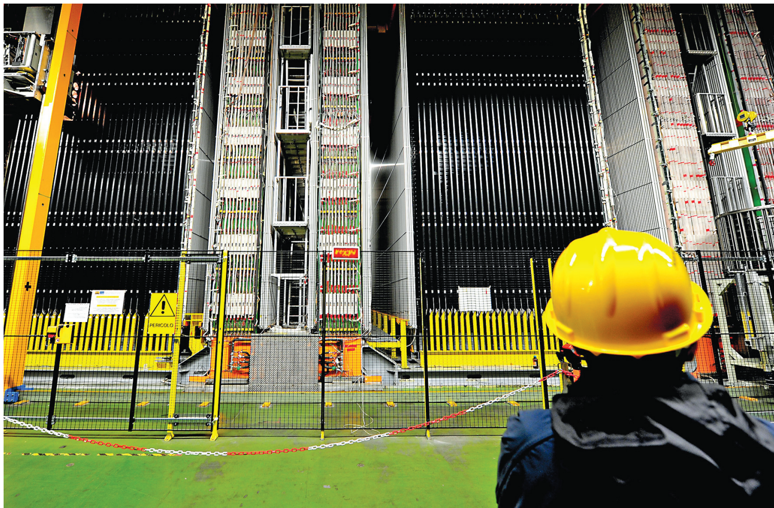
Le détecteur de neutrinos du Laboratoire de Gran Sasso, en Italie. L'engin de 1800 tonnes a capté le faisceau de neutrinos en provenance du CERN circulant à une vitesse supérieure à celle de la lumière.

Si l'observation est confirmée, cela voudra donc dire que le neutrino muonique — la catégorie de neutrino observée par l'équipe du CERN — est «une particule qui n'est pas du tout comme les autres et qui vit dans un autre monde. On peut imaginer qu'elle vit dans un monde à part, mais qui se manifeste néanmoins dans notre monde. Depuis que la nouvelle a été annoncée, une multitude de conjectures sur ce que ce phénomène pourrait signifier ont été formulées. Certains physiciens émettent l'hypothèse que la vraie vitesse [limite] serait celle des neutrinos et que la lumière n'irait pas aussi vite parce qu'elle est ralentie. [...] D'autres avaient déjà proposé le concept de tachyons, des particules qui se déplaceraient plus vite que la lumière, qui peut être prévu dans certaines théories des cordes. Il s'agit toutefois d'un concept mathématique qu'on n'a