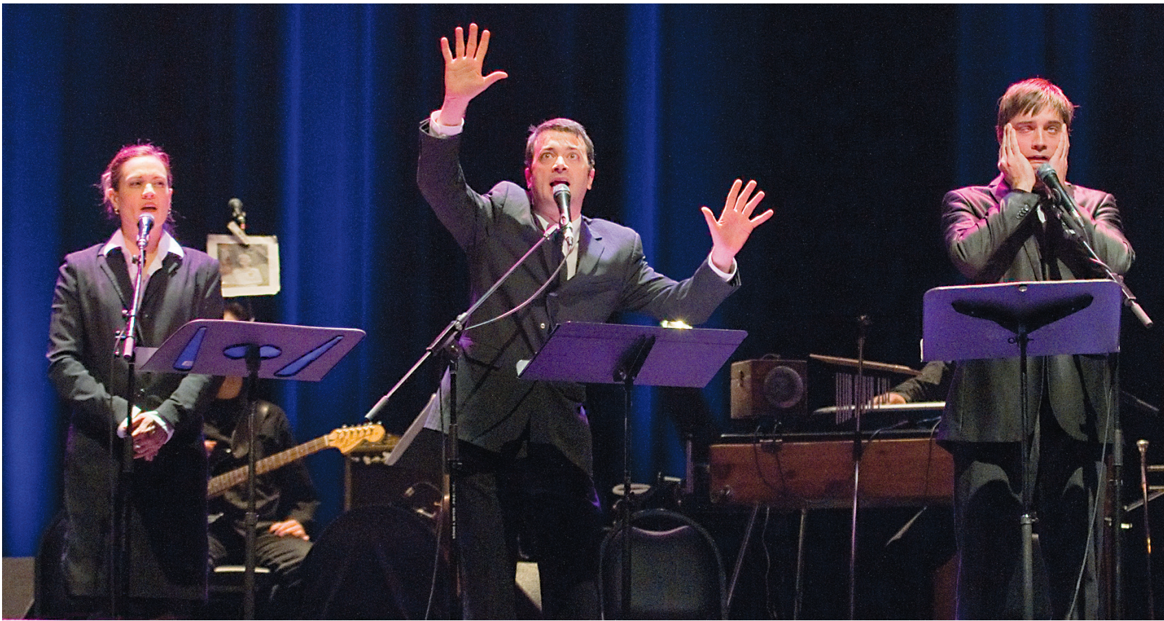
Les Zapartistes, spécialistes de l'humour politique, sur la scène du Métropolis, jeudi soir, pour présenter leur revue de l'année, Zap 2011.