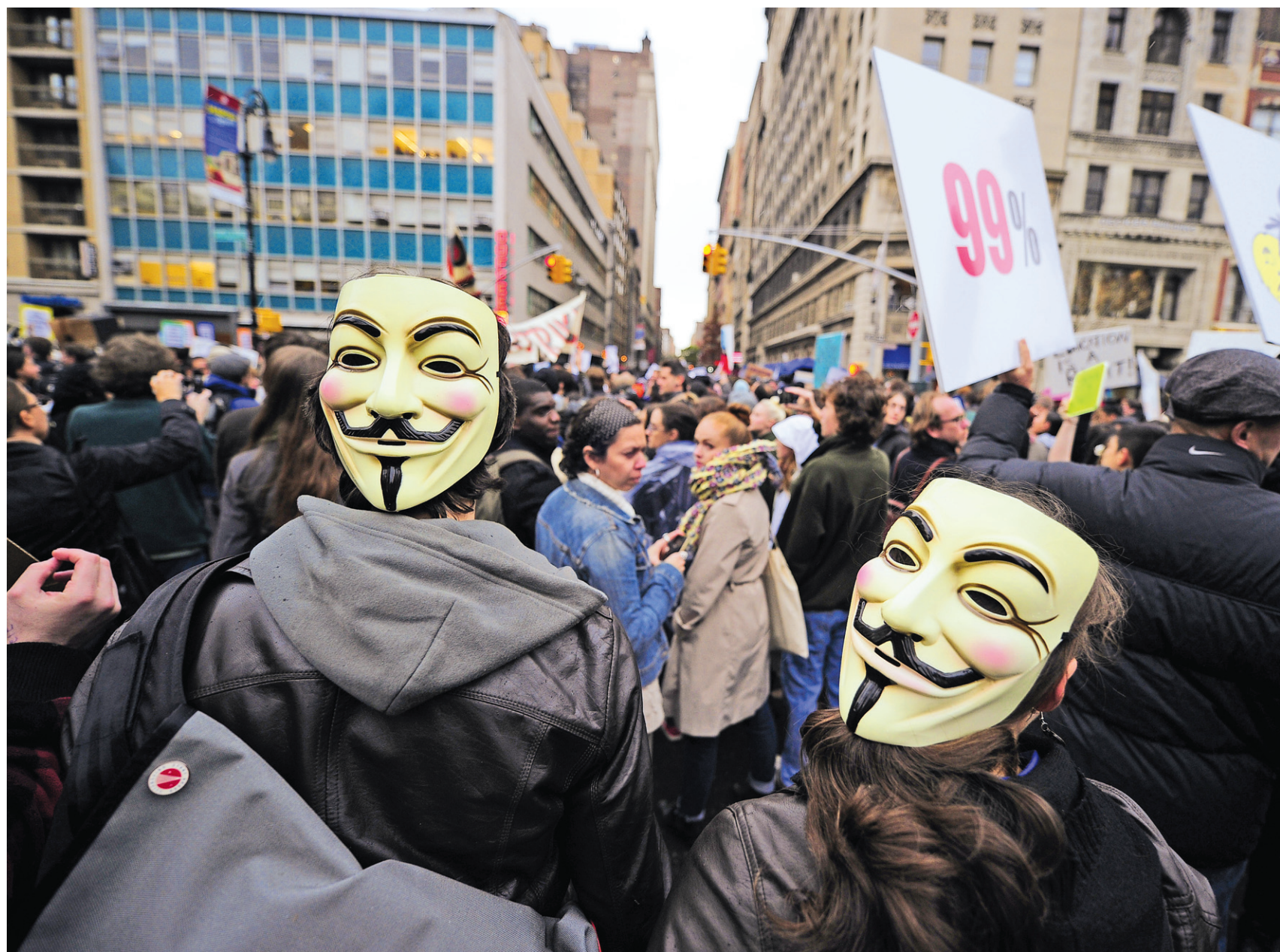
Le masque inspiré du visage du martyr anglais Guy Fawkes et popularisé par la série de bandes dessinées et le film V pour vendetta a inspiré le mouvement des indignés à New York, Londres, Madrid et autres villes à travers le monde.