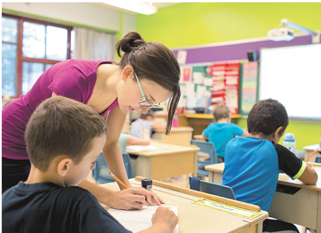
« Madame Jessica » apprivoise depuis trois semaines sa première classe. Elle se sert du controversé tableau blanc interactif pour l'éveiller.