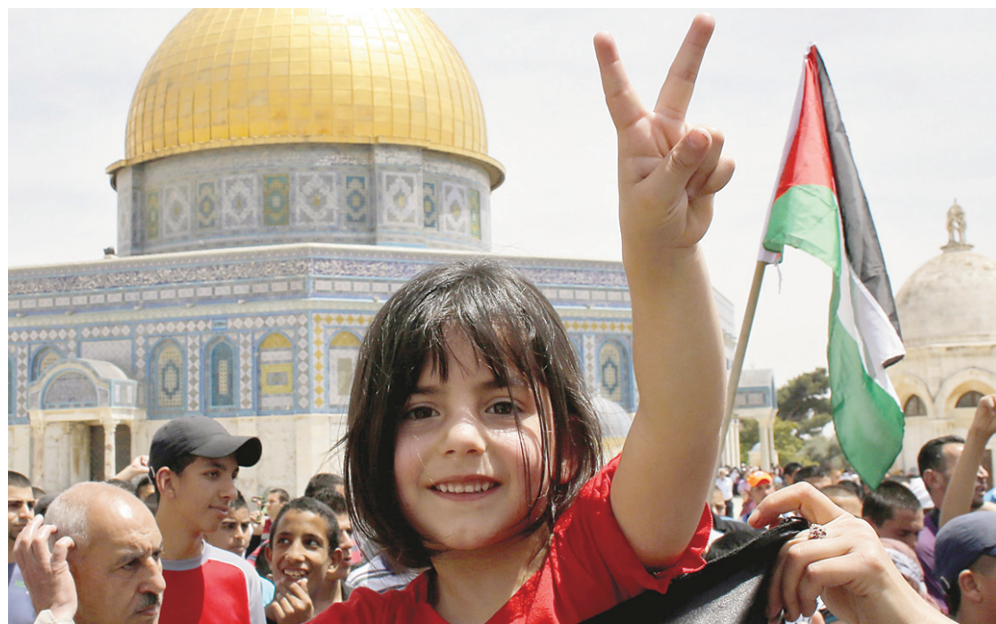
Des Palestiniens commémorent la Nakba, ou « catastrophe », qui, pour eux, remonte au 14 mai 1948, jour de la déclaration d'indépendance d'Israël.

Lundi | Israël rêve d'être un pays normal.