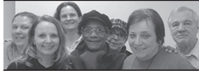
Équipe du journal