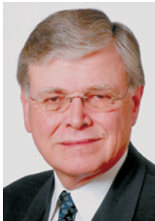
Dear Fellow Citizens,