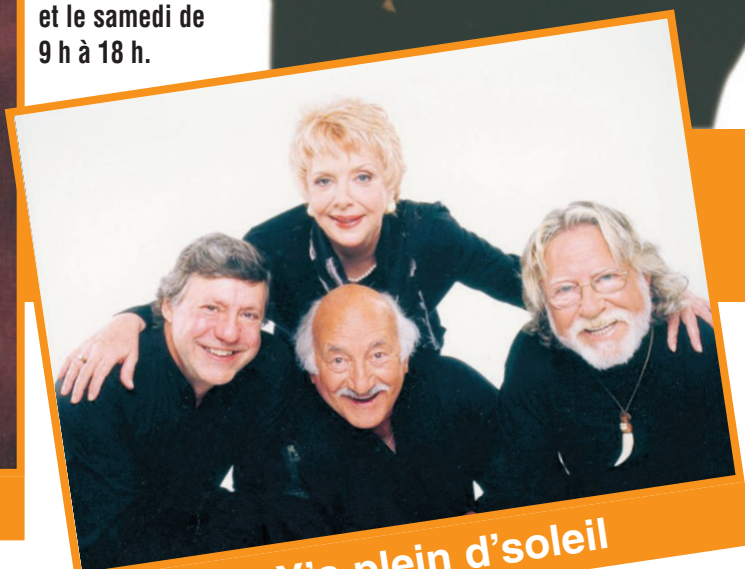
L'équipe Y'a plein d'soleil

Le salon est ouvert de 9 h à 21 h les jeudi et vendredi et le samedi de 9 h à 18 h.