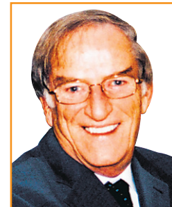
Honorable Jean Lapointe

Nous vous invitons donc à partager notre enthousiasme en participant avec nous au Salon des Générations de Gatineau, Québec et Montréal. Et si on y allait ensemble?