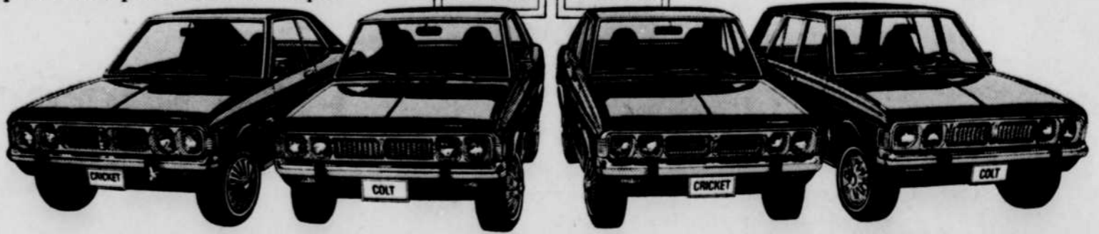
Plymouth Cricket et Dodge Colt offertes en coupés, hardtops, sedans et familiales.

Plymouth Cricket • Dodge Colt. À votre choix. Voyez-les chez les concessionnaires Plymouth et Dodge.