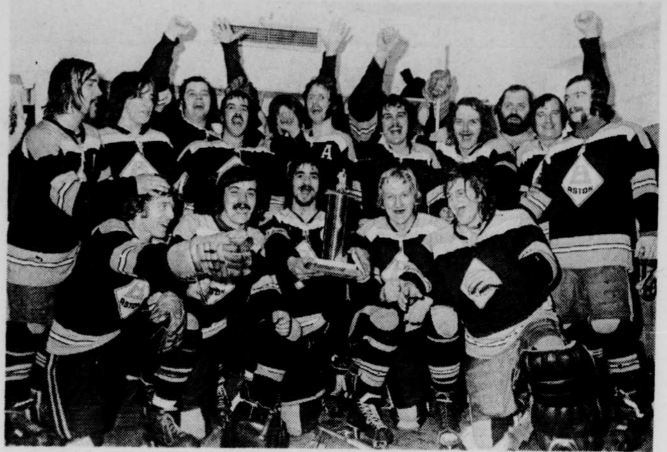
L'équipe d'Aston, vainqueur dans le "B"