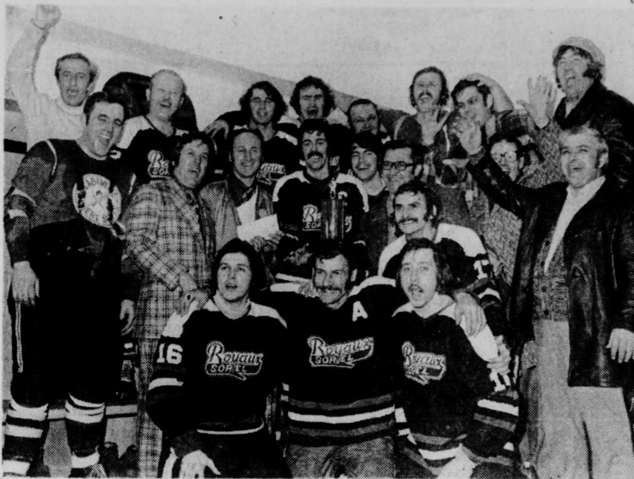
Les Royaux de Sorel, champions du "A"