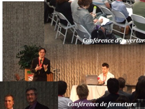
Conférence de fermeture