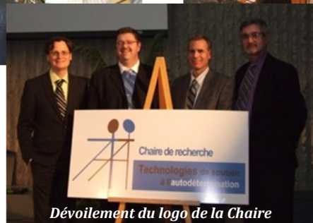
Dévoilement du logo de la Chaire