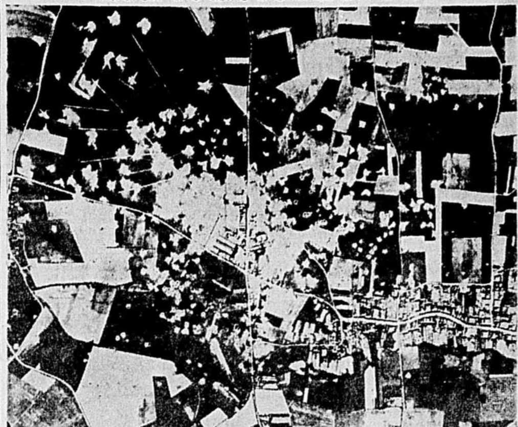
Cette photo, prise par un avion de reconnaissance américain, à une altitude de 30,000 pieds. L'usine en question est située à Meaulte. Au centre, on voit des entrepôts qui ont été atteints. Des bombes ont également éclaté sur la route où de petits points noirs indiquent l'ombre que projettent les camions qui y circulent. La partie ombrée, près de la route, au centre, vient du camouflage qui masque une partie de l'usine.