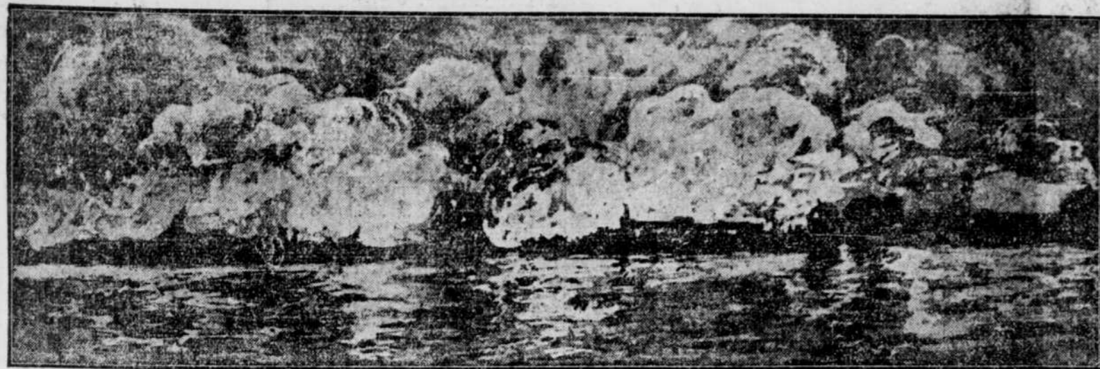
LE GRAND FEU DE SACO.—La scène, dans la nuit, sur le bord de la rivière, au moment où l'incendie faisait rage dans les cours à bois et dans la manufacture de boîtes.