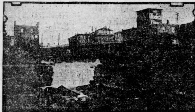
Une vue d'un endroit pittoresque, à Saco, où le feu a fait ses ravages.

Voilà donc, soixante-six familles canadiennes-françaises qui ont été chassées de leurs demeures par le feu. La plupart des victimes ont accepté l'aide de leurs compatriotes et se sont réfugiés chez eux; mais un grand nombre des familles ont passé la nuit qui a suivi l'incendie, sur les bords de la rivière.