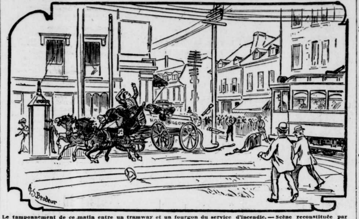
Le tamponnement de ce matin entre un tramway et un fourgon du service d'incendie. — Scène reconstituée par un dessinateur de la "Presse".

Une voiture de pompiers vient en collision, ce matin, avec un tramway. — Les occupants sont renversés dans la rue et échappent à un grave danger.