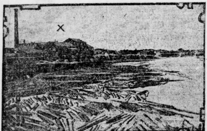
Les usines de la "Saco River Lumber Co.", où les pompiers ont concentré tous leurs efforts pour arrêter le progrès de la conflagration.