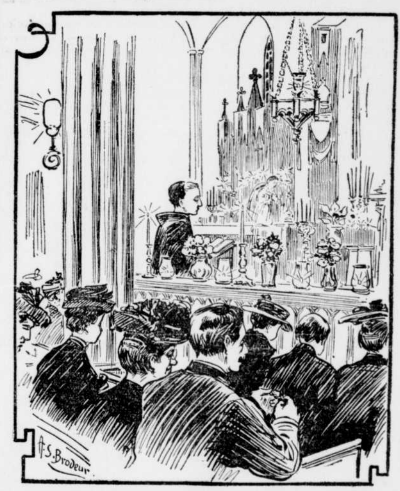
Le Triduum chez les Franciscains. — La foule répond au chaplet, récité par un des Pères.

Ouverture d'un triduum solennel, hier soir, à l'occasion du 50ième anniversaire d'ordination de Sa Sainteté le Pape Pie X.