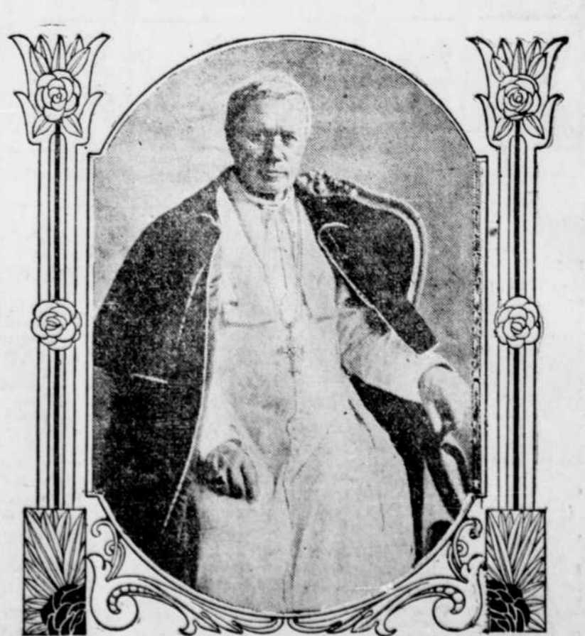
SA SAINTETE PIE X, QUI CELEBRERA VENDREDI SON 50IEME ANNIVERSAIRE DE PRETRISE.