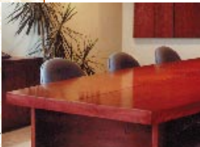
Design et fabrication Consett

Le bouleau jaune, que l'on appelle aussi « merisier », est l'un de nos arbres feuillus le plus recherché pour le bois d'oeuvre. Son bois dur à grains serrés résiste bien aux chocs. Il se façonne facilement. On s'en sert en ébénisterie et pour fabriquer des boiseries, des portes et des parquets.