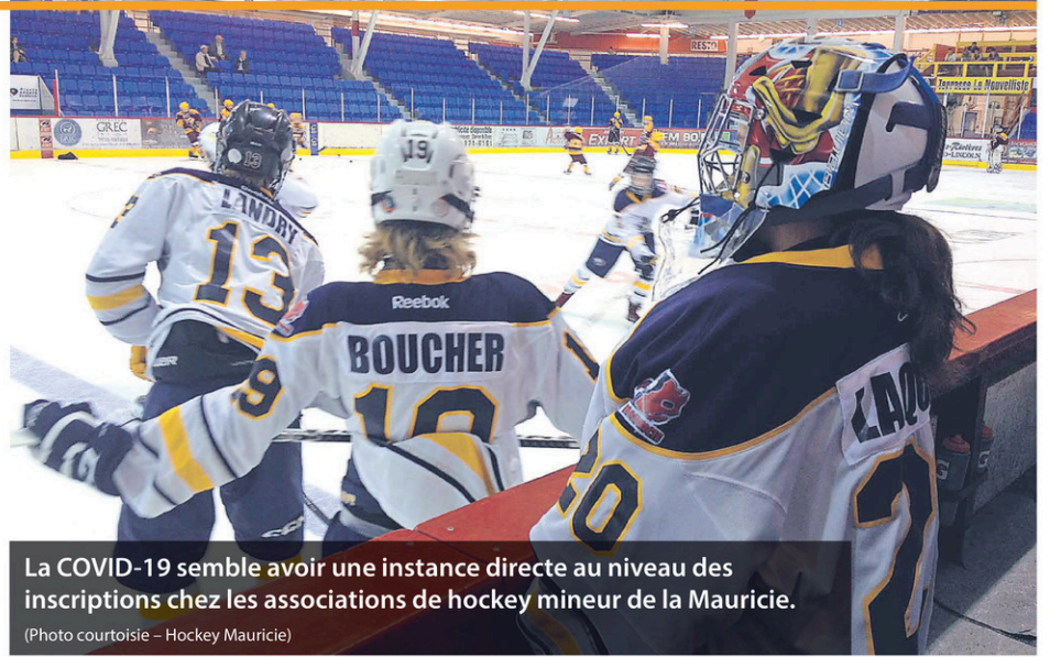
La COVID-19 semble avoir une instance directe au niveau des inscriptions chez les associations de hockey mineur de la Mauricie.

«C'est sûr qu'il y a certaines craintes et on ne peut pas dire que nous n'aurons aucun cas de COVID. Par contre, il faut vaincre ce virus-là et il faut inscrire nos jeunes, les faire jouer et s'amuser, un peu comme les travailleurs sont retournés à leur emploi. Le tout va se faire dans un environnement de respect envers les mesures sanitaires et il faut que nos jeunes puissent continuer à jouer», confie-t-il.