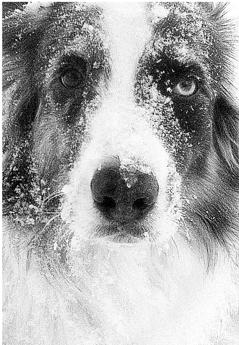
En s'approchant, on remarque des détails, on peaufine et on soigne notre composition, fait remarquer notre photographe Erick Labbé.

on peut utiliser le bouton de volume pour prendre la photo, mais je ne le conseille pas parce que celui-ci est difficile à enfoncer et fait bouger l'appareil.