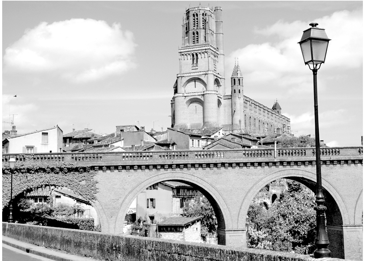
La cathédrale Sainte-Cécile domine la ville d'Albi, dans le sud-ouest de la France.