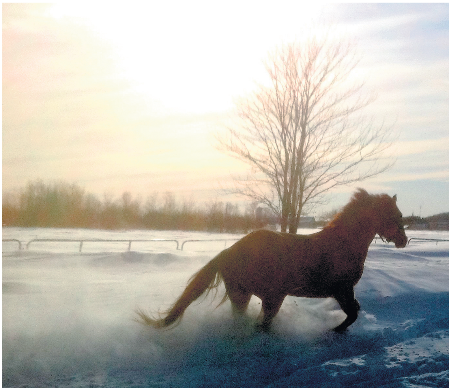
La plus belle lumière, chaude et douce, est celle suivant le lever du soleil et précédant son coucher.

A vec un téléphone dans les poches, on est toujours prêt à dégainer pour immortaliser un souper entre amis, le château de sable de fiston, un superbe arc-en-ciel, et ce, qu'on soit dans sa cour arrière ou en voyage. Avec ces appareils ultra-simples, nous sommes tous devenus un peu photographes. Mais est-ce que nous sommes toujours satisfaits de nos clichés? Huit trucs pour réussir ses photos avec son téléphone.