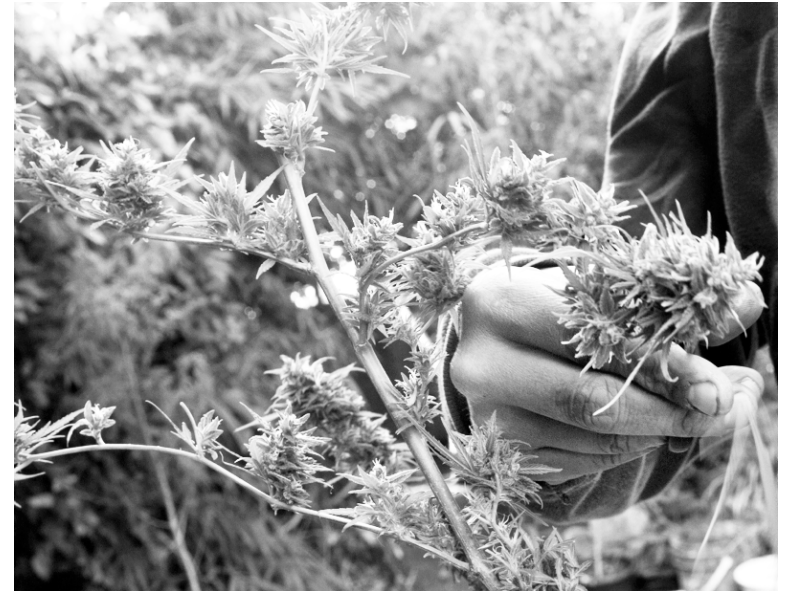
L'Uruguay a été le premier pays au monde à nationaliser la vente de cannabis et de ses dérivés et à en autoriser la production à petite échelle.

On estime à 30 000 ou 40 000 le nombre de personnes cultivant déjà