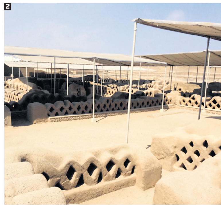
1 La plage de Huanchaco est très populaire auprès des habitants de Lima.