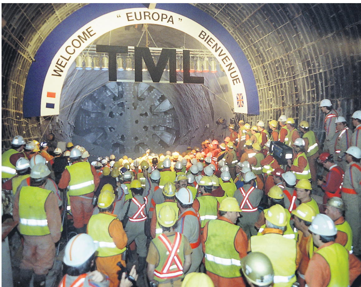
Dans cette photo prise le 22 mai 1991, des travailleurs français et britanniques observaient le tunnelier Europa en train de creuser la galerie nord du tunnel.

Aujourd'hui, ces îliens vivent mal une grève ou une paralysie du trafic. Les médias ont largement fait écho à la colère des Londoniens «piégés»