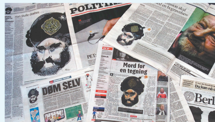
La caricature avait été reproduite par plusieurs journaux.