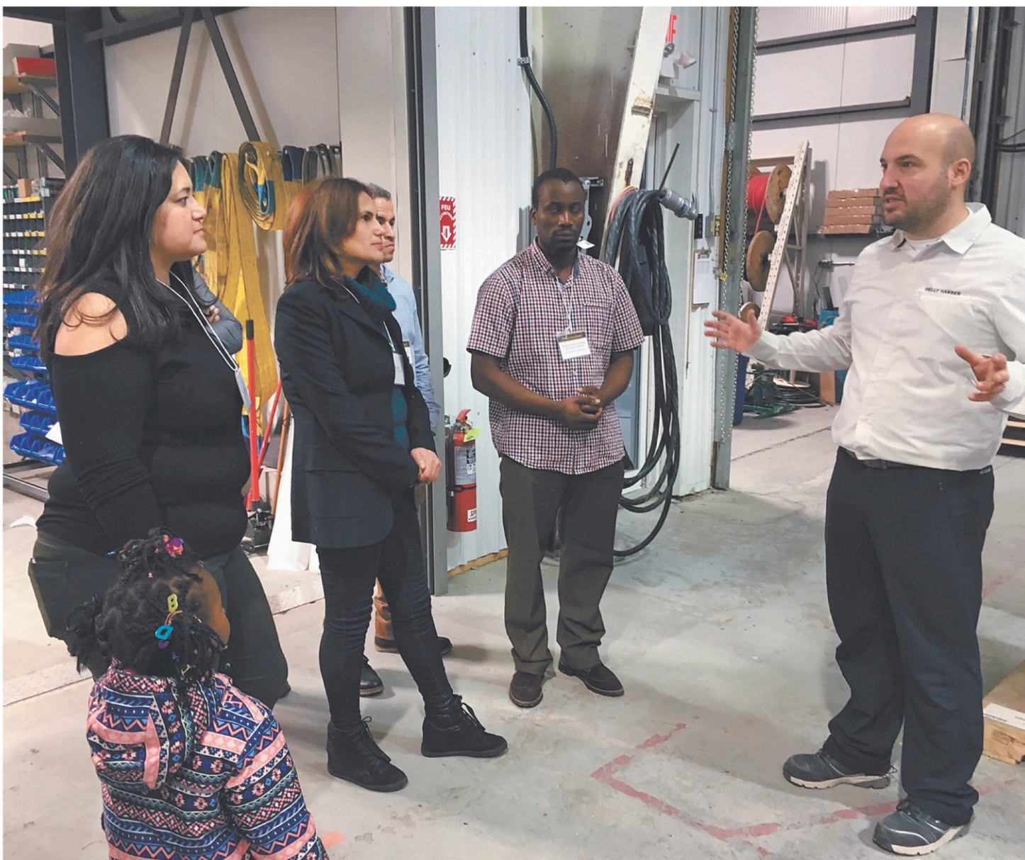
Selon le CIRANO, le gouvernement québécois devrait faire un effort particulier pour faire comprendre à la population les bienfaits de l'immigration, notamment en ce qui a trait à la pénurie de main-d'œuvre. Sur la photo, une visite industrielle à Val-d'Or d'immigrants à la recherche d'un lieu où s'établir pour contribuer à la société québécoise.