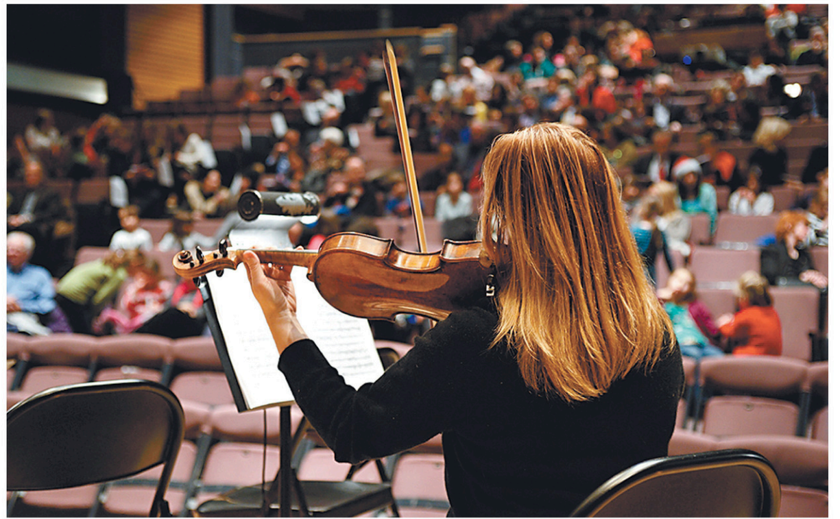
Incertaines de la somme disponible pour les sorties culturelles pour la prochaine année scolaire, plusieurs directions d'écoles ont opté pour l'annulation de ces activités éducatives.