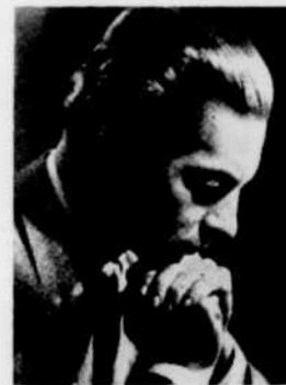
Herbert von Karajan