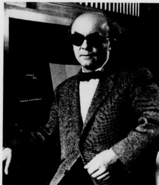
Jean Langlais, organiste à l'église Sainte-Clotilde de Paris, et successeur de César Franck.