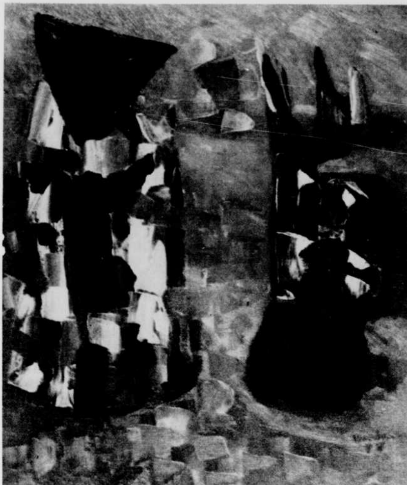
Nonne et prêtre babyloniens (Borduas, 1948).

L E 22 février 1960, mourait à Paris, d'une crise cardiaque, le peintre québécois Paul-Émile Borduas. Depuis 1955, il vivait solitaire dans son atelier parisien, tout occupé d'exprimer sur la toile ses visions de poète et ses « chères certitudes ».