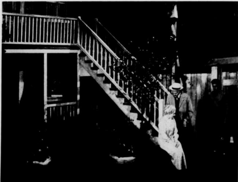
Scène prise au cours d'une représentation à Paris. Les vieux et Roméo demeurent seuls, après tous les départs.

Paul Blouin réalisera le Temps des lilas .