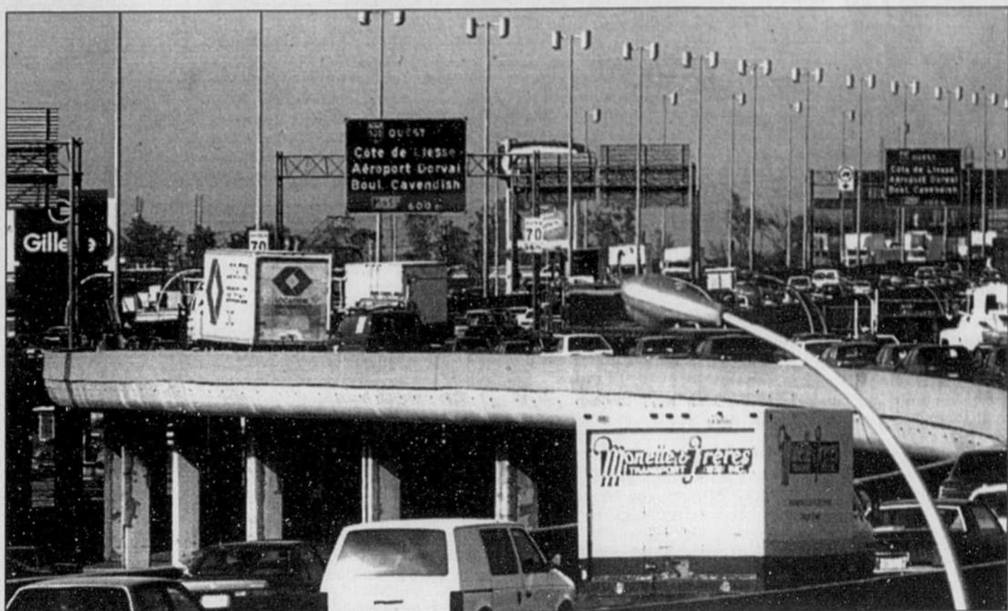
Que ce soit à Montréal ou en Californie, il n'est pas aisé de consulter d'un oeil une carte et, en même temps, de conduire au milieu d'une dense circulation.

■ En collaboration avec Etak, l'un des leaders dans la fabrication de logiciels spécialisés dans les fonds cartographiques, le géant de l'électronique Sony prévoit diffuser son système à partir de l'automne prochain. Lui aussi, au début, ne couvrira que