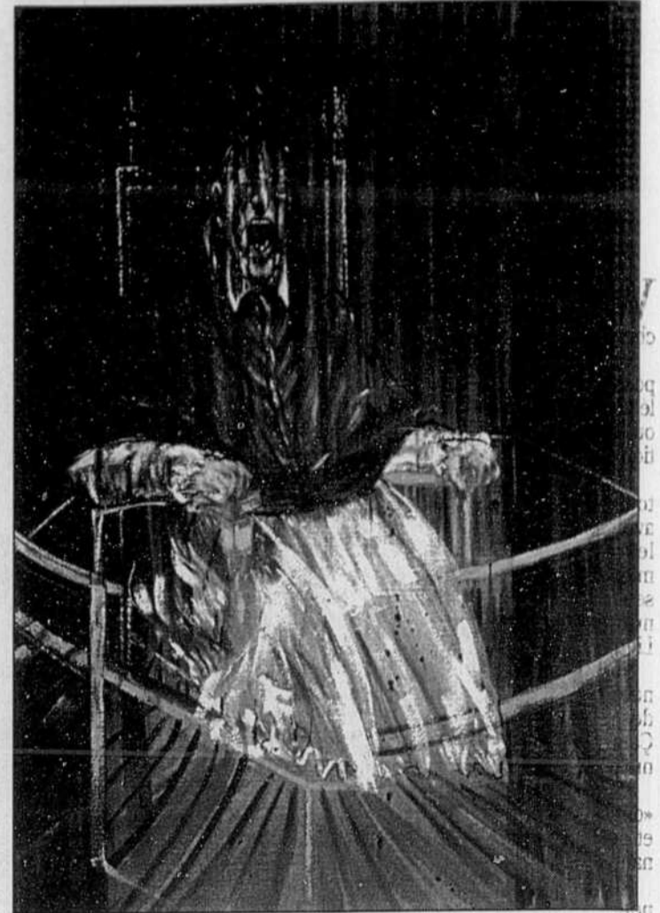
Étude d'après un portrait du pape Innocent X par Velasquez, une oeuvre de Francis Bacon.

Ces Églises font face à d'énormes problèmes non seulement sociaux, mais aussi organisationnels. Au plan financier par exemple, elles vivent en quelque sorte sous perfusion, jusqu'à 90% de leur budget provenant de l'étranger.