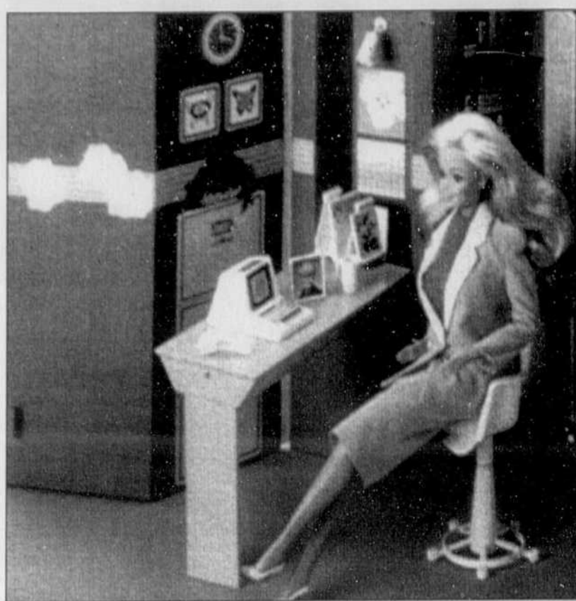
Avec Barbie, une poupée adulte, les petites filles ont pu se projeter dans l'adolescence et même au-delà.

La poupée la plus populaire de tous les temps