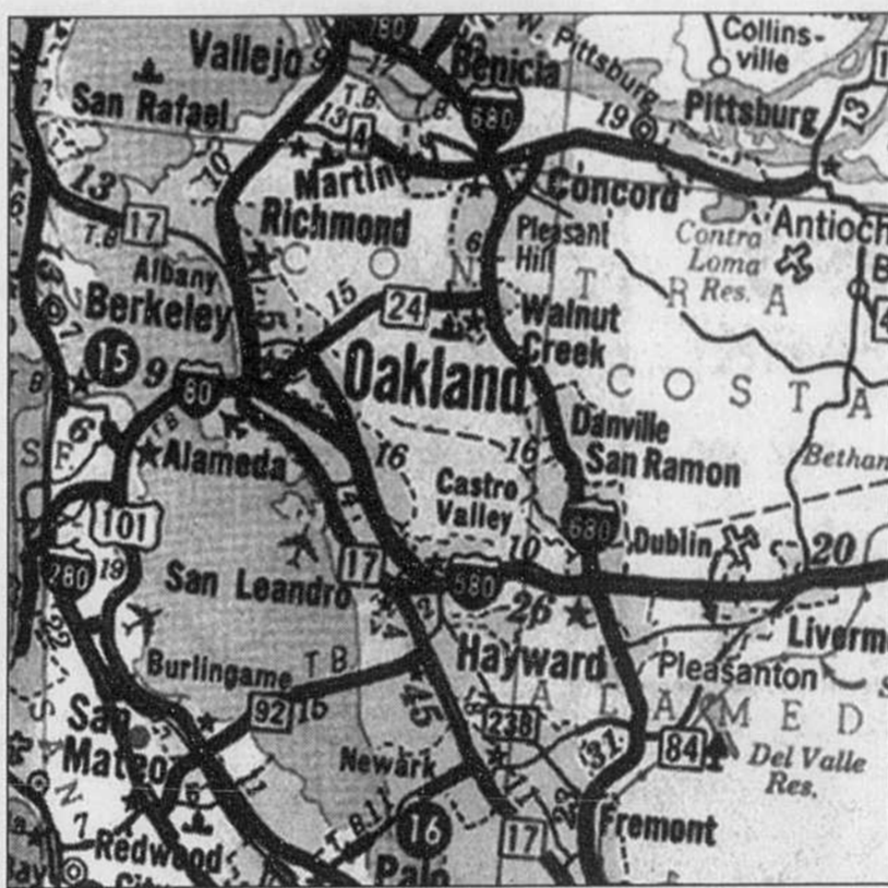
CARTE TRAVEL VISION

Au-delà de leurs quelques différences, ces systèmes fonctionneront de la même façon. Ils recevront des signaux d'un ré-