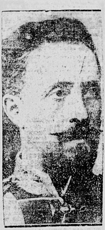
Le grand-duc NICOLAS de Russie est gravement malade à Antibes, France. Il joua un rôle important dans la guerre mondiale.