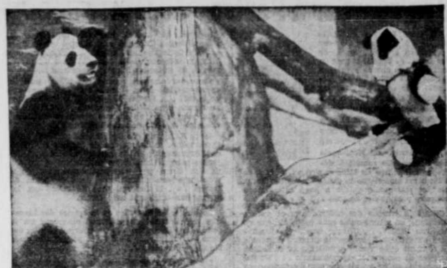
Une petite surprise — Comme le roi Arthur cherchait le saint Graal, les photographes de journaux veulent leur vie et leurs énergies à chercher "quelque chose de différent". L'auteur de cette photo amena un panda jout au Jardin zoologique de Bronx, et l'introduisit dans la cage des pandas géants du zoo. Il croyait le voir réduct en pièces. Mais le vrai panda chercha refuge derrière un tronc d'arbre et se mit à converser avec le joeur. Le photographe devait en être content. Peut-être est-ce "quelque chose de différent", après tout.

Le capital avec lequel la compagnie commencera ses opérations est de $80,000.