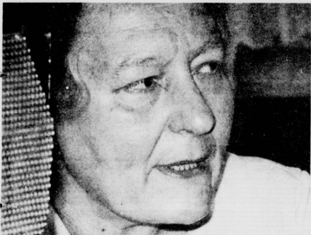
Madame X craignait le pire mais les tests sont négatifs.