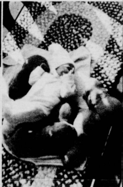
Peu de temps après la naissance de ALEXANDRA, la chienne des Lalonde, Cherry, donnait, elle aussi, naissance à une belle progéniture.