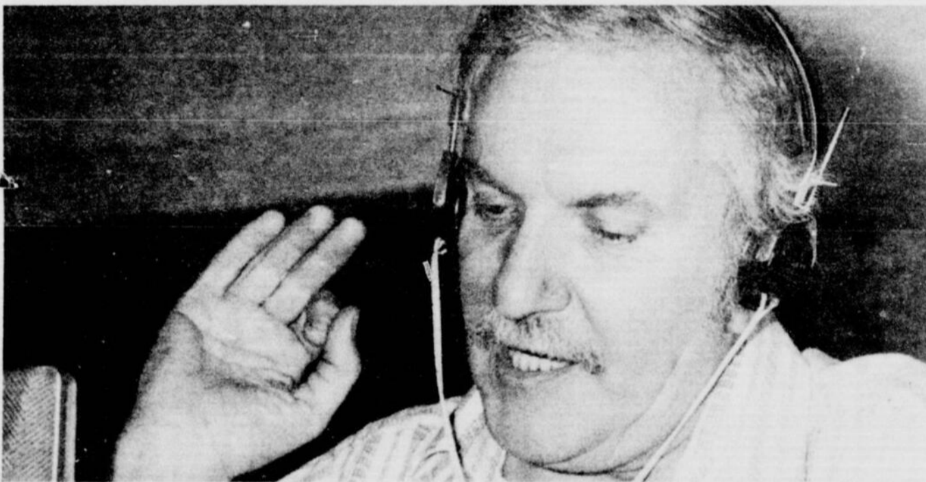
Jean Duceppe n'en est pas à un job près.

Madame X a passé cinq heures endormie et ignore combien de temps a duré son opération. Chose certaine, elle sait qu'elle va récupérer et c'est enfin de compte ce qui importe.