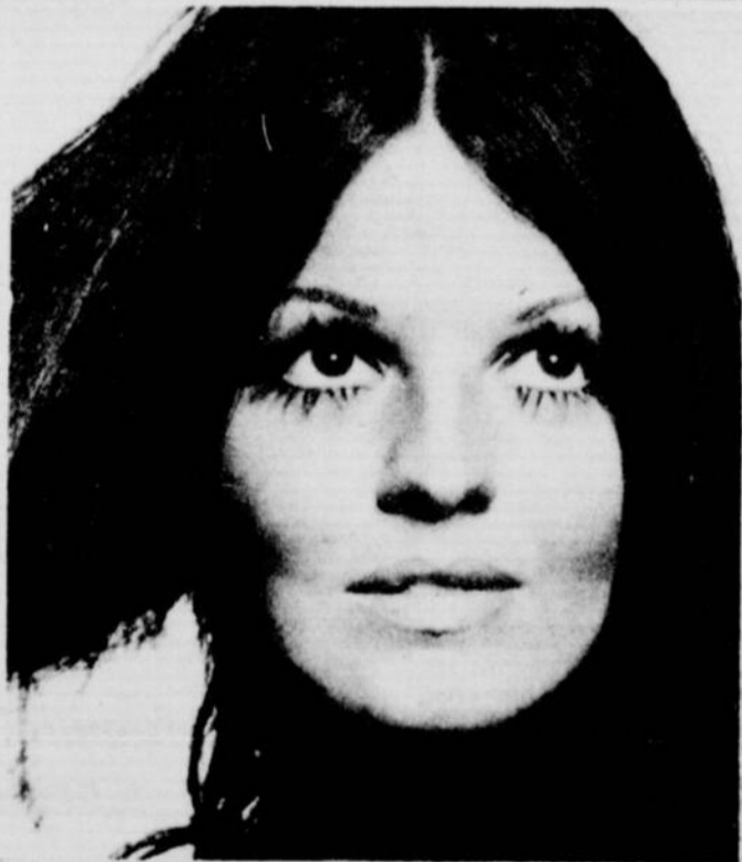
Pour Michèle Richard, une façon bien particulière d'exploiter son nom.

Sera-t-elle impliquée financièrement? Bien sûr. Elle sera à profits partagés avec plusieurs autres artistes, mais pourrait bien devenir une des principales intéressées, d'autant plus que le monde des affaires intéresse de plus en plus la chanteuse.