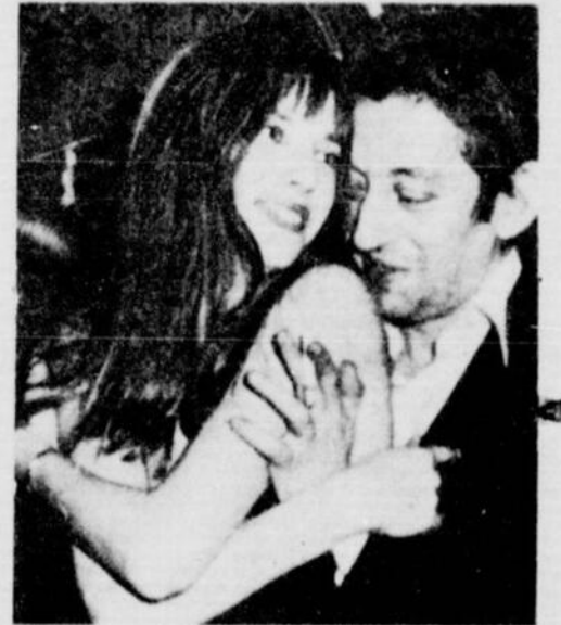
GAINSBOURG-BIRKIN ... ils dansent maintenant!

Les artistes qui ont obtenu du succès cette année au Festival du M.I.D.E.M. sont, entre autres, Danyel Gérard (« Butterfly »), Francis Lai, Henri Salvador, Nicoletta, Les Zoo, Mélanie, Raymond Lefebvre, et Eddy Barclay qui, sans chanter, rien que par sa seule présence, a enlevé la vedette à tout l'monde. Les journaux signalaient le retour à la chanson de Michelle Torret Hervé Vilard.