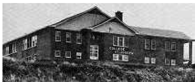
Le collège Saint-Joseph pour les garçons