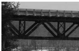
Le pont des « chars »

C'est la construction du chemin de fer qui amène la communauté polonaise dans la région et entraîne celle du pont des « chars », imposante structure d'acier sur pilier de béton, haute de 10 mètres et mesurant 52 mètres de long.