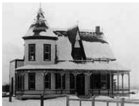
Maison Joseph-Lafontaine située au 199, 12 e rue.