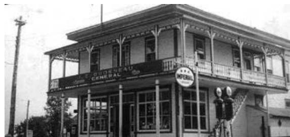
Le magasin général Elzéar-Brosseau