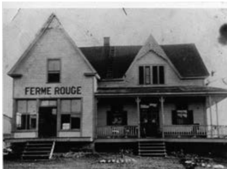
La Ferme Rouge, appelée à l'origine la ferme de la femme rouge.