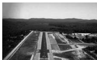
L'aéroport de La Macaza, 150, chemin Roger-Hébert

Utilisant l'ancienne piste d'atterrissage de la base militaire, un aéroport, inauguré en 2002, accueille des vols transportant des touristes venus de New York et de Toronto skier dans les Laurentides et jouir des attraits régionaux. Avec son revêtement en bois rond et sa toiture de style château, l'aérogare est un bâtiment unique dans la région.