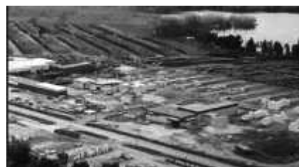
Moulin à scie Meilleur