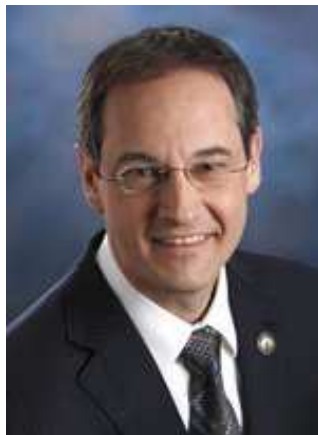
Sylvain Pagé, Député de Labelle

472, rue Mercier Mont-Laurier (Québec) J9L 2W1