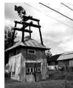
Moulin à vent situé au 403, chemin des Cascades.