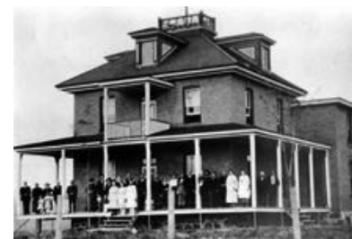
Presbytère de Val-Barrette