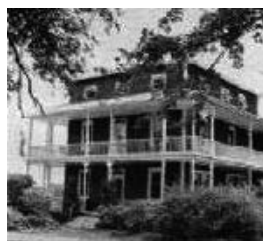
Maison Pierre-Beaulieu au 1260, route 309 N.