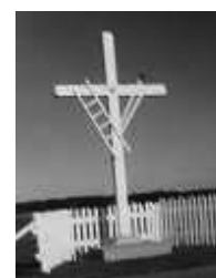
Au 95, 1 er rang Wurtèle