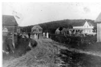
La ferme Wabassee