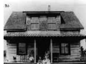
Maison Elphège-Émard, au 168, route 311.