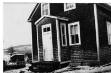
L'école no 2