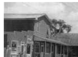
Magasin Ernest-Dufour situé au 382, rue Principale.