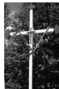
Croix de chemin du 54, route 311.