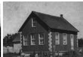
L'école de la vallée à Josaphat