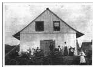
Maison Grenier-Constantineau, au 1, chemin Constantineau.