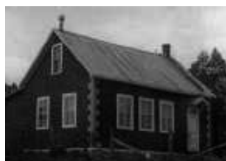
L'école du Wabassée