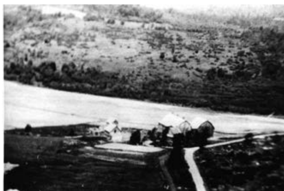
La Ferme Saint-Joseph