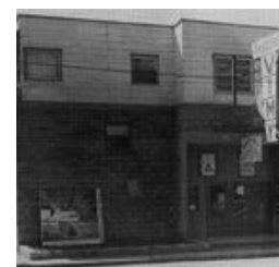
Le Théâtre Vimy à l'origine