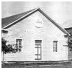
La chapelle sert de lieu de culte de 1919 à 1935.

Construite sur un promontoire situé au cœur du village, l'église, érigée en 1935, offre une vue magnifique sur le lac qui lui fait face. Inspirée du style espagnol des missions chrétiennes qu'on rencontre, entre autres, en basse Californie et au Mexique, la toute blanche église a remplacé la chapelle-école, construite en 1919, qui servait à la fois au culte et à l'enseignement. Entourée de l'Hôtel de ville, de la salle communautaire, bâtie en 1943, d'une halte pour véhicules récréatifs, d'une aire de repos face au lac et d'un quai public, elle est le