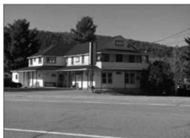
Auberge de la Presqu'île