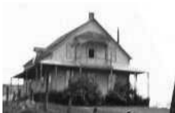
La première chapelle

décision ne satisfait cependant pas les villageois demeurant à la tête du lac. Ils se séparèrent du village et se tournent vers la religion anglicane. Ils bâtissent une chapelle, une école et ont leur propre cimetière situé encore sur le chemin Tour du Lac-des-Îles.