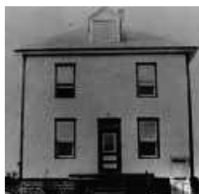
Maison Napoléon-Blais au 29, chemin Saint-Louis.