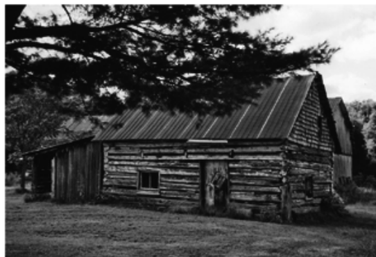
Maison Bondu à Lac-du-Cerf