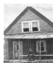
Maison Avenant-Émard au 218, rue Principale.