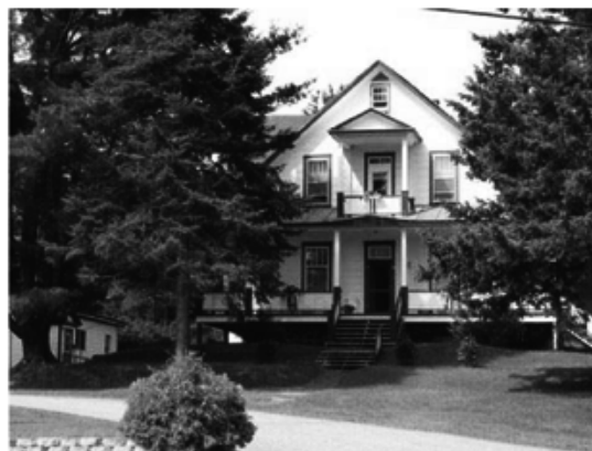
Presbytère de Sainte-Anne-du-Lac