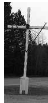
Croix de chemin installée à l'intersection des chemins Poissant et du Pérodeau.

Situées à quelques kilomètres du village, deux croix de chemin marquent le paysage. La plus ancienne aurait été plantée au début des années 1900, par la famille Michaudville, pour rappeler que des enfants morts en bas âge auraient été enterrés à cet endroit. À l'intersection des chemins Poissant et du Pérodeau, l'autre rassemblait les gens du voisinage pendant le mois de Marie (mai). Plus tard, la compagnie forestière MaLaren l'entretient pour servir de repère à ses employés qui travaillent à la ferme Tapani. La municipalité voit maintenant à son entretien.