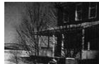
Maison Palma-Duciaume 29, chemin Duciaume.