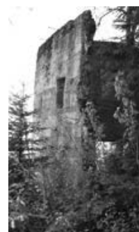
Les vestiges du moulin à scie d'Alphonse Raoul Bédard.

Deux curiosités sont à signaler. D'abord, les vestiges du moulin à scie d'Alphonse Raoul Bédard sur le chemin de la Sylve près de la piste cyclable du P'tit train du Nord . C'est tout ce qui reste d'un village qui a compté plus de 300 habitants, trois moulins à scie, deux chantiers, un magasin général, une école, un bureau de poste, une petite chapelle et un hôtel dont le prêtre desservant se plaint qu'il soit plus fréquenté que sa chapelle.