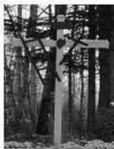
Croix de chemin située à l'intersection du chemin du Rang-Double et des Pionniers.

Parmi les attractions chères aux Macaziens et Macaziennes signalons la croix de chemin, refaite en 2008, près du pont couvert, et un vieux moulin à vent, ancêtre de nos éoliennes, témoignant de l'ingéniosité des premiers colons. Il alimentait une pompe suffisant alors aux besoins d'eau de la famille et de la ferme.