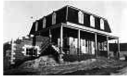
Maison de pension Poulin