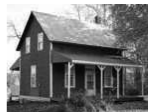
Maison Landry-Ti-Mé-Paquette 1210, route 309 Nord.