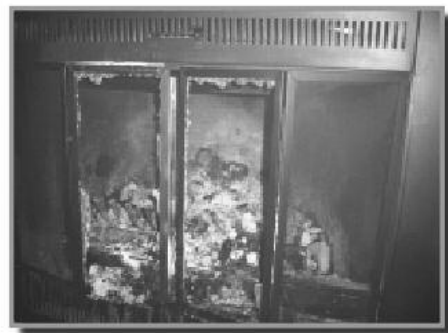
Éclatement des vitres d'un foyer causé par l'utilisation de bûche écologique