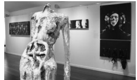
Pique-nique des créateurs - Mini Camp - Salle des Courroies : visite d'interprétation - La Relâche au Moulin - Exposition Synthèse (finissants Cegep Bce-Appalaches)