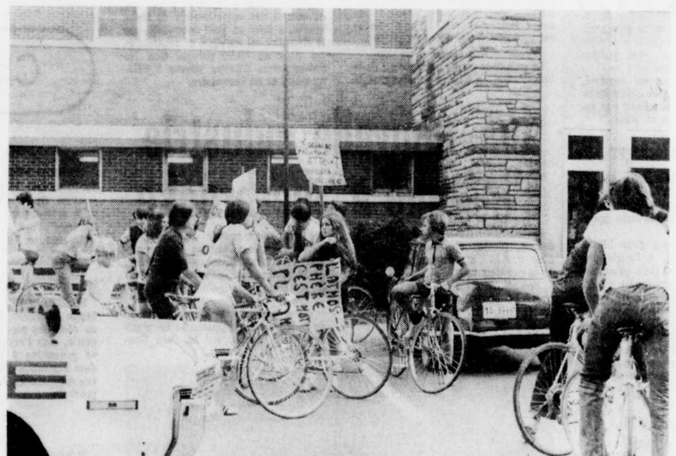
Une cinquantaine de jeunes cyclistes étaient de la manifestation, mercredi dernier. Malheureusement les adultes n'ont pas semblé comprendre le message de ces jeunes.