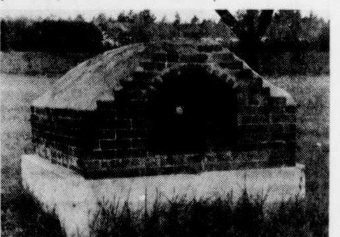
Le four à pain en bordure de la route 27.

Les membres de la Chambre de commerce sont donc invités à se rendre à la Légion canadienne, sur la rue Bibeau, jeudi le 23 août, à 8 heures p.m.