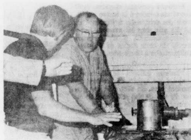
Un technicien démontre ici comment se servir du vert de malachite dans le traitement de maladies des oeufs du poisson.

La station est située à 30 milles de Sherbrooke. Il suffit de prendre la route 22 jusqu'à Coaticook, puis de la, la route 50 jusqu'à Barnston, puis à 5 milles de là, se trouve la station qui est ouverte au public quotidiennement durant la belle saison.