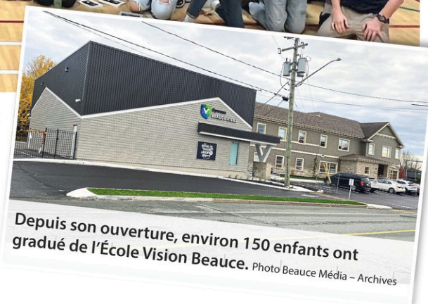
Depuis son ouverture, environ 150 enfants ont gradué de l'École Vision Beauce.

Ainsi, l'activité sera très probablement renouvelée, ceci possiblement aux cinq ans. « Nous souhaitons en faire une tradition. Ça a été demandé et c'est important pour nous », conclut-elle.