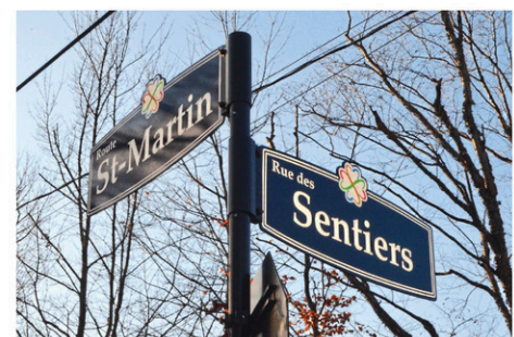
La rue des Sentiers est située sur la route St-Martin, non loin de l'autoroute 73.