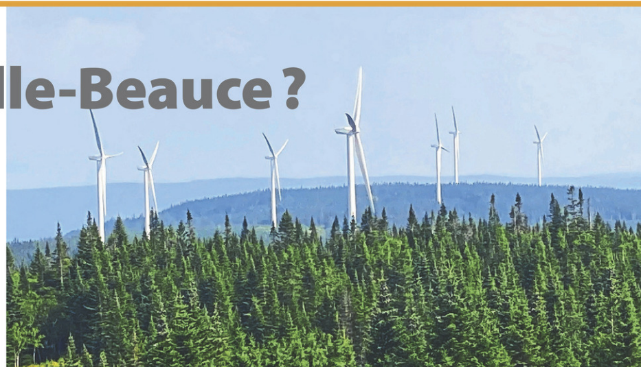
Le territoire de la Nouvelle-Beauce présente un potentiel intéressant pour des promoteurs éoliens.