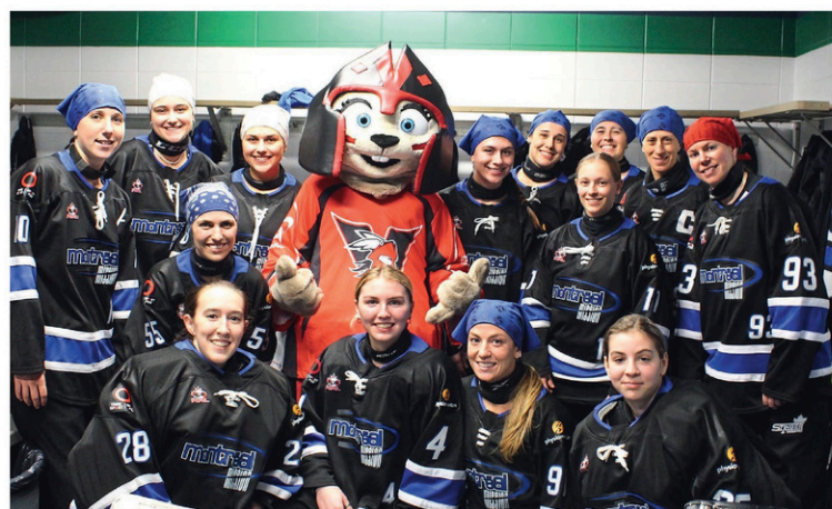
La mascotte Valky, en compagnie du Montréal Mission.

hors-concours de la Ligue nationale de ringuette (LNR) le samedi 18 novembre dernier au Centre Caztel. Pour l'occasion, le Rive-Sud Révolution de la Montérégie et le Montréal Mission se sont affrontés devant plus de 1100 spectateurs.