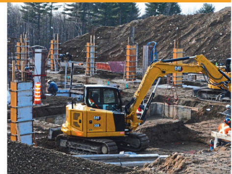
À cette heure, deux projets de multilogements ont déjà été confirmés.