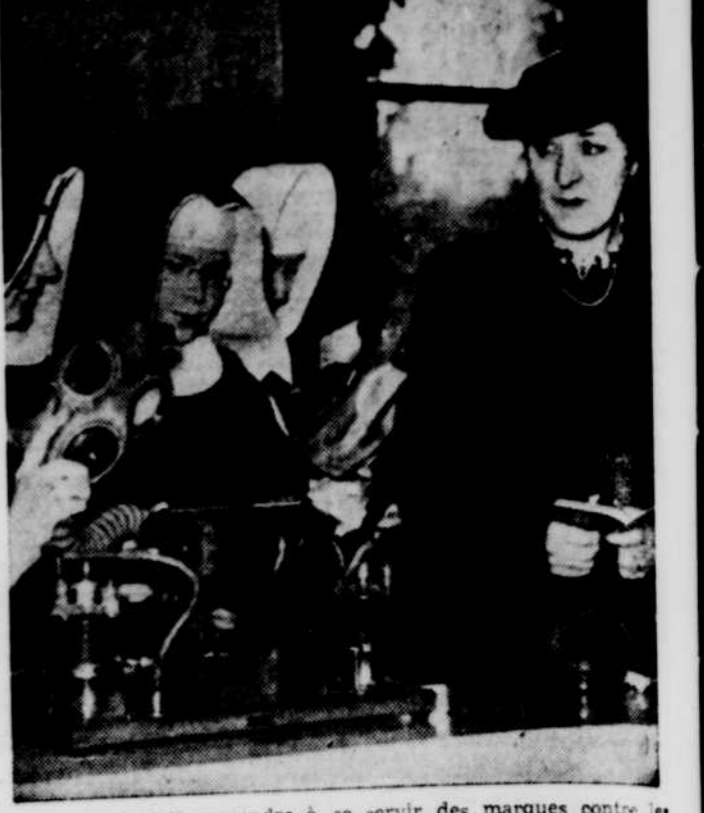
Tout le monde doit apprendre à se servir des marques contre les gaz, même les bonnes religieuses que l'on voit ici en compagnie de leur institutrice, la marquise douairière de Reading, présidente des volontaires féminins d'Angleterre.

Jeune or soldat: $1.95 R. ANGRIGNON HORLOGER EXPERT BIJOUTIER 973 Champlignon, T.-Rivières Tel. 3665