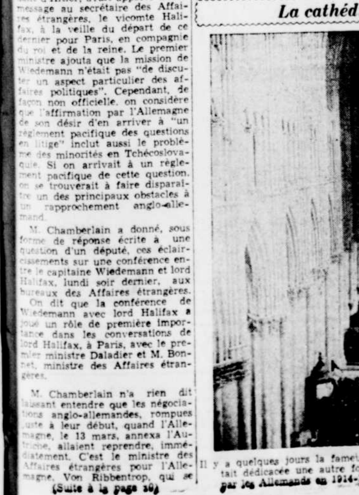
La cathédrale de Reims