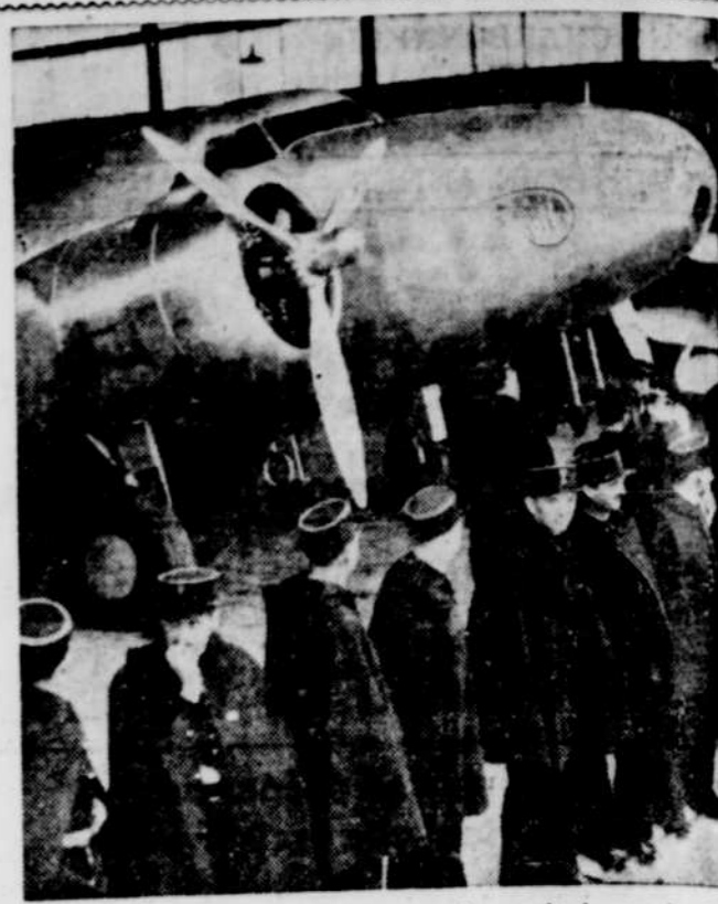
Pendant la traversée de Hughes autour du monde, la semaine dernière, on a constaté que le fameux aviateur et ses compagnons étaient revenus à New-York cinq jours avant que les photos prises à Paris, lors de leur passage, fussent revenues aux Etats-Unis.