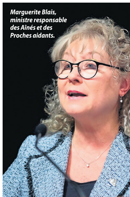
Marguerite Blais, ministre responsable des Aînés et des Proches aidants.

« Nous avons vu à quel point les personnes proches aidantes sont la force tranquille de notre réseau de santé au cours de la pandémie de la COVID-19, et leur contribution doit être reconnue dans nos institutions. Avec ce projet de loi, nous allons bien plus loin que nos engagements électoraux : nous nous assurons de pérenniser les acquis pour les personnes proches aidantes au-delà des gouvernements en place », a affirmé Madame Blais.