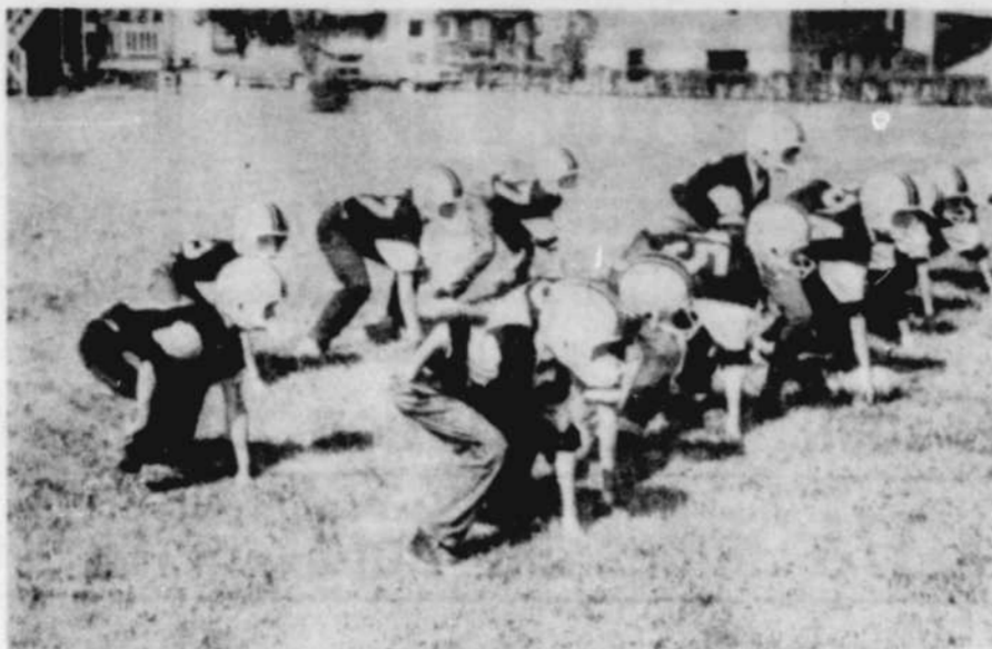
JOUEURS DE FOOTBALL EN HERBE. — Cette photographie fait voir l'équipe offensive du club des Lions de Ste-Famille qui doit participer aux joutes de championnat local du football mineur à Victoriaville.