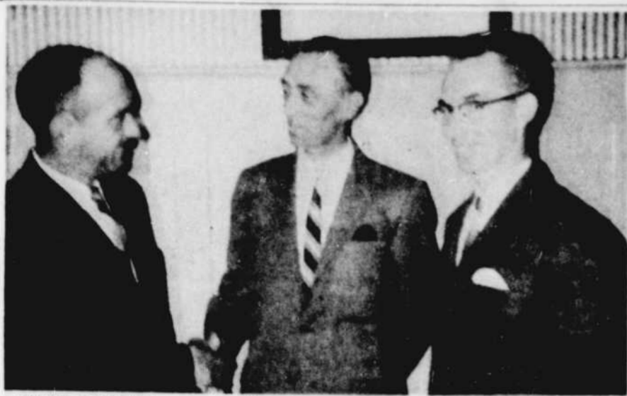
NOUVEL EXECUTIF. — Les membres de la Chambre de commerce ont formé un nouveau comité exécutif...